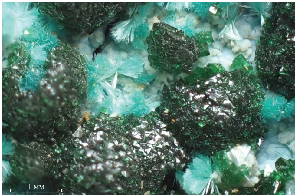
Рис. 1. Пучки, кустообразные и веерообразные сростки игольчатых кристаллов петерсита-(Y) бледно-бирюзового цвета между густо-зелеными сферолитами и пучками кристаллов малахита на голубовато-белой корочке опала. Меднорудянокое месторождение.

Fig. 1. Sprays and bush- and fan-like clusters of light turquoise-colored acicular crystals of petersite-(Y) between deep green spherulites and bunches of malachite crystals on bluish-white opal crust. Mednorudyanskoe deposit.