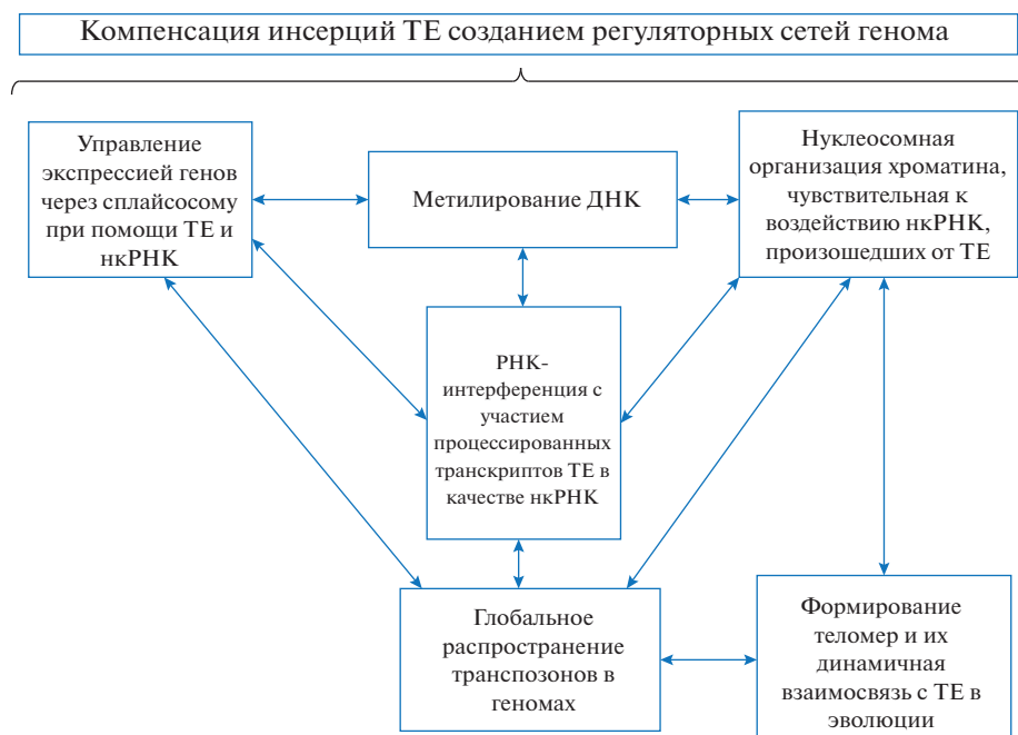
Рис. 2. Универсальные консервативные системы, возникшие благодаря транспозонам и способствовавшие возникновению и эволюции эукариот.

вые мРНК быстро деградируют при ингибировании репликация ДНК по 3'–5' пути, при котором требуется обширное уридилирование промежуточных продуктов распада мРНК [73]. Для генов гистонов характерны отсутствие интронов и кластерная организация в виде тандемных повторов [71]. Указанные особенности гистонов позволяют предположить роль TE в их возникновении и формировании в эволюции с сохранением в отборе наиболее оптимальных вариантов, ставших консервативными для всех эукариот. Хотя, несмотря на консервативность гистонов, у многоклеточных эукариот два семейства, гистон H2A и гистон H3 , значительно диверсифицировали по ключевым остаткам. При филогенетическом анализе по линии зеленых растений показана ранняя диверсификация семейства H2A у одноклеточных зеленых водорослей и значительные экспансия H2A вариантов у цветковых растений [50]. Новые варианты гистонов были выявлены у множества видов, и многие сходные с гистонами последовательности были аннотированы в качестве псевдогенов в геномных базах данных, однако их тканеспецифическая экспрессия была подтверждена путем секвенирования 3'-нетранслируемых областей (3'UTR) транскриптов. Предполагается, что разнообразие вариантов H3 , приобретенных после разделения видов, сыграло роль в регулировании тканеспецифической экспрессии генов отдельных видов [72]. Канонические белки гистонов кодируются репликационно-зависимыми генами (организованными в тандемные класте-