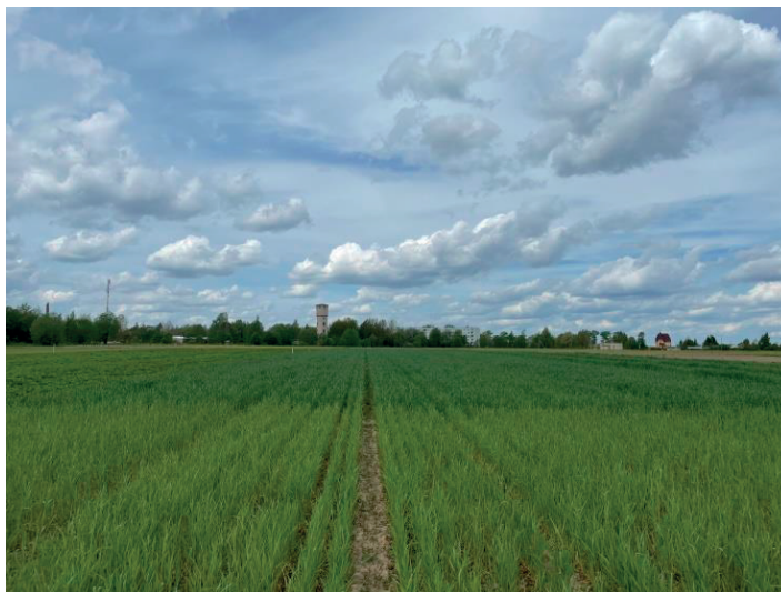
Рис. 1. Стационарный полевой эксперимент, озимая рожь.