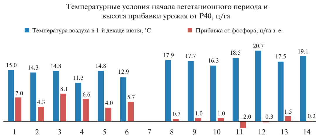
Рис. 1. Уровень прибавок урожайности (ц з.е./га) от добавления P40 к N50 в зависимости от температуры воздуха в первой декаде июня, 1971–1999 гг.

менения фосфорного удобрения чаще сопутствовали низкие температуры воздуха 1-й декады июня (11–15°C). Во 2-й группе за 9 лет 6 раз высокие прибавки были получены в условиях, когда в начале июня температура воздуха была в пределах 11–16°C. За 4 года со средними прибавками в 2 из них тоже была отмечена пониженная температура. Значительно теплее было в большей части лет, относящихся к последней группе (17–20°C), исключением были всего 2 года. Достаточно стройной становится обсуждаемая зависимость, если исключить нетипичные данные в 2-х контрастных группах (рис. 1).