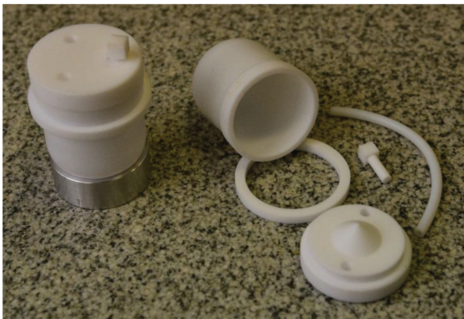
Рис. 1. Фторопластовые стаканы для разложения.

нагревательную лабораторную плиту (ПЛП-03, Томьяналит) с двумя независимыми секциями нагрева и с возможностью программирования режимов нагрева.