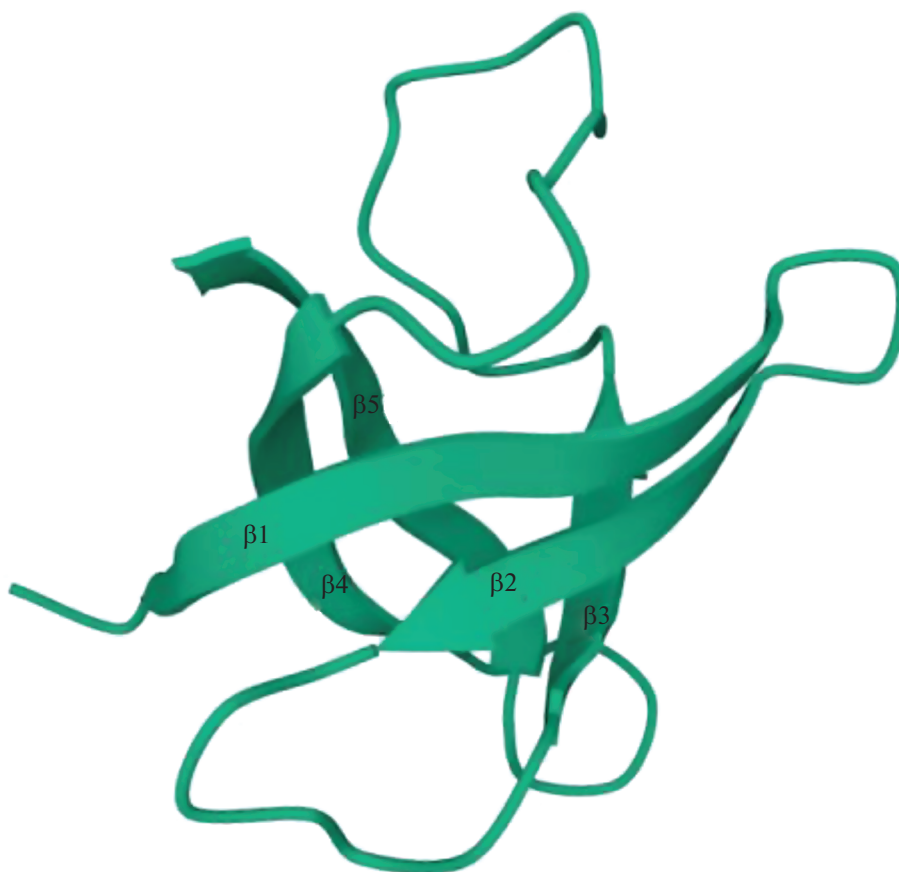
Рис. 1. Кристаллическая структура белка CspA E. coli (PDB ID: 3MEF).

руется низкими температурами [8], одного (CspD) – голоданием и в ранней стационарной фазе, два экспрессируются на постоянном уровне (CspC и CspE) [10]. Триггеры экспрессии CspF и CspH до сих пор неизвестны.