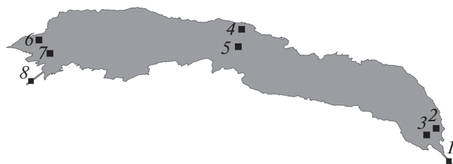
Рис. 1. Местонахождение станций на р. Дзабхан и Тайширском водохранилище: 1 – р. Дзабхан выше водохранилища, 2 – побережье в верховье водохранилища, 3 – центр верховья водохранилища, 4 – побережье на среднем участке водохранилища, 5 – центр среднего участка водохранилища, 6 – побережье в приплотинном участке водохранилища, 7 – центр приплотинного участка водохранилища, 8 – р. Дзабхан ниже водохранилища.

Для статистического анализа данных использовали U-тест Манна–Уитни, H-критерий Краскела–Уоллиса и коэффициент корреляции Спирмена ( p < 0.05 ).