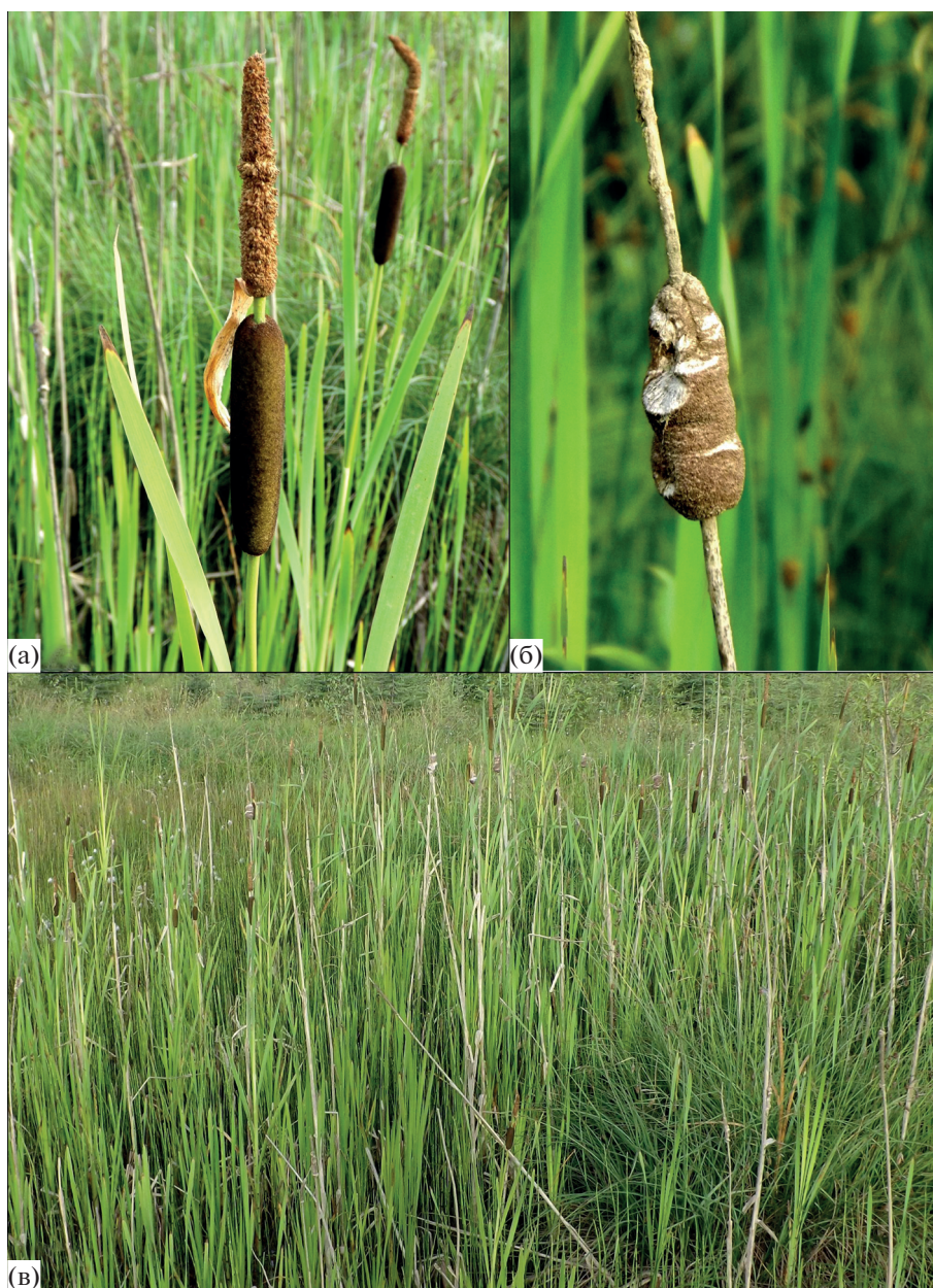
Рис. 1. Общий вид растений Typha littoralis A. Krasnova et Efremov: а – общий вид соцветий; б – общий вид соплодия; в – фитоценоз с доминированием T. littoralis .

роткой ножке. Волоски гинофора многочислен- ные, достигают середины столбика. Семена вер- теновидные со швом по центру, вверху скошен- ные, заостренные.