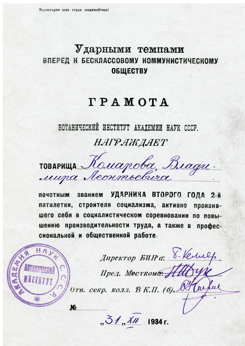
Рис. 4. Грамота В.Л. Комарова — ударника второй пятилетки. 1934 г.

Fig. 4. Certificate of honor to V.L. Komarov as udarnik [shock worker] of the second year of the second five-year plan. From State Central Museum of the Modern History of Russia.