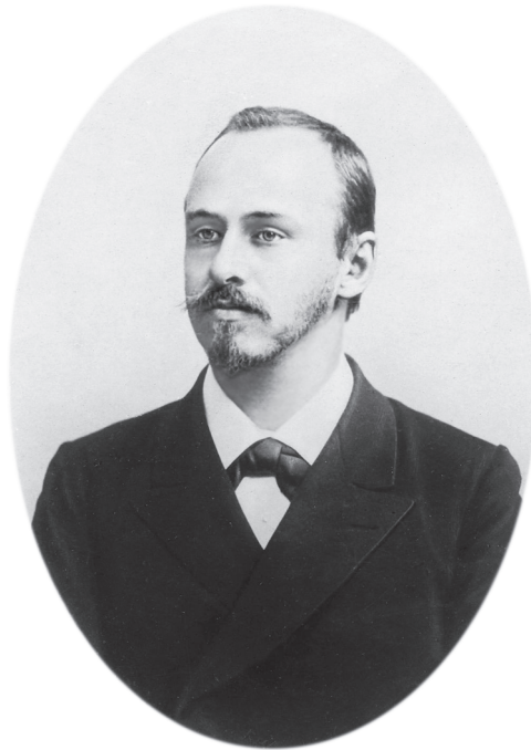
Рис. 1. В.Л. Комаров в 1899 г.