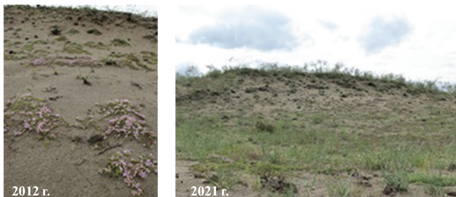
Рис. 2. Ценопопуляция Thymus mongolicus в песчаной степи (Центральная Тувинская котловина) в разные годы исследования.

Изучение ценопопуляции как сложной системы, характеризующейся изменением организменных и популяционных параметров, позволяет выявить особенности популяционного поведения вида в разных эколого-ценотических условиях обитания (Zaugol'nova, 1994; Zhukova, 1995). Ранее нами установлено, что для неявиополицентрических видов тимьянов в сообществах петрофитных степей характерны следующие особенности развития: наличие семенного и вегетативного размножения; начало вегетативного размножения в зрелом генеративном состоянии; неглубокое омоложение рамет (до молодого генеративного состояния); длительное зрелое генеративное состояние; партикуляция в старом генеративном состоянии, что обуславливает накопление в ЦП