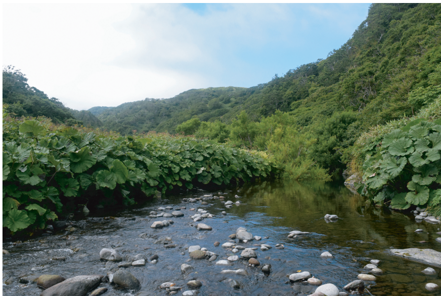
Рис. 4. Сообщество белокопытника Petasitetum japonici . Fig. 4. Petasitetum japonici .

tis-idaea , Parnassia palustris , Rhodiola rosea , Tilingia ajanensis , Arnica unalaschcensis , Hedysarum nonnae , Ophelia tetrapetala и др. Как правило, такие сообщества приурочены к нарушенным местообитаниям — они были встречены на старых дорогах и на заросшем аэродроме.