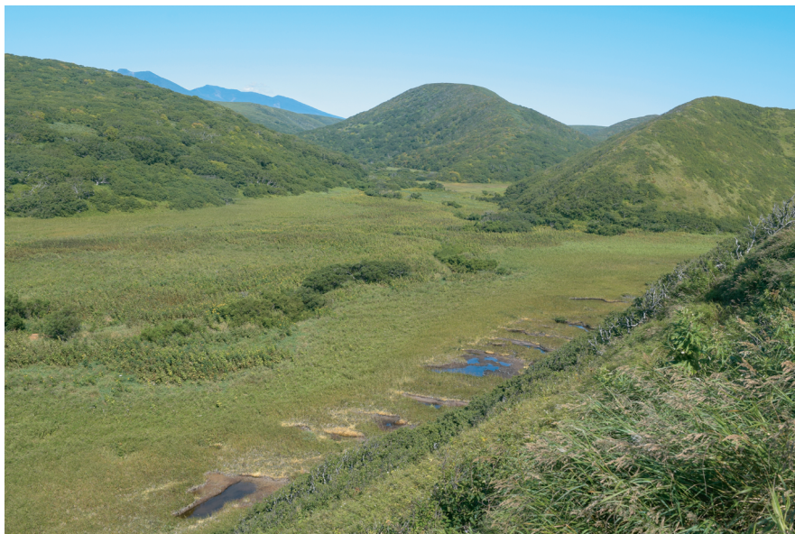
Рис. 7. Долина р. Кама в нижнем течении.