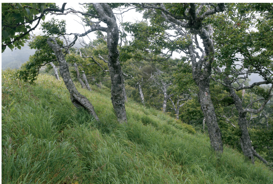
Рис. 3. Каменноберезняк вейниковый Calamagrostio-Betuletum ermanii . Fig. 3. Calamagrostio-Betuletum ermanii .

встречались более молодые 12–15 см. В остальных же случаях древостой выглядел более-менее одновозрастным.