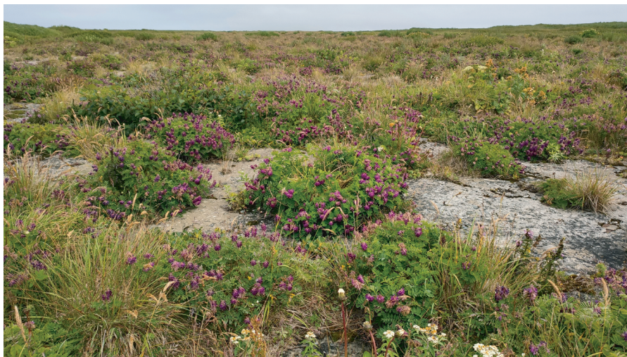
Рис. 6. Зарастающий аэродром.