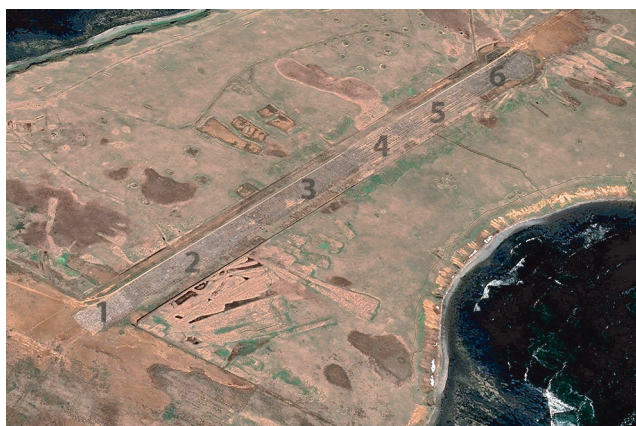
Рис. 5. Расположение сообществ на зарастающем аэродроме. Fig. 5. Location of communities on an overgrown airfield.

2. На увлажненном участке растения образуют полосы вдоль трещин. Такие участки осваивают преимущественно Hedysarum nonnae и Trisetum molle , вместе с ними встречаются Taraxacum ceratophorum , Anaphalis margaritacea , Deschampsia para-