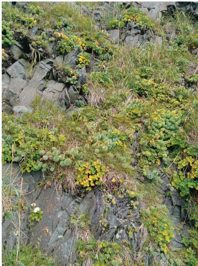
Рис. 1. Скальная растительность.