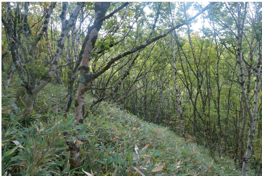
Рис. 2. Каменноберезняк бамбучниковый Saso-Betuletum ermanii . Fig. 2. Saso-Betuletum ermanii .