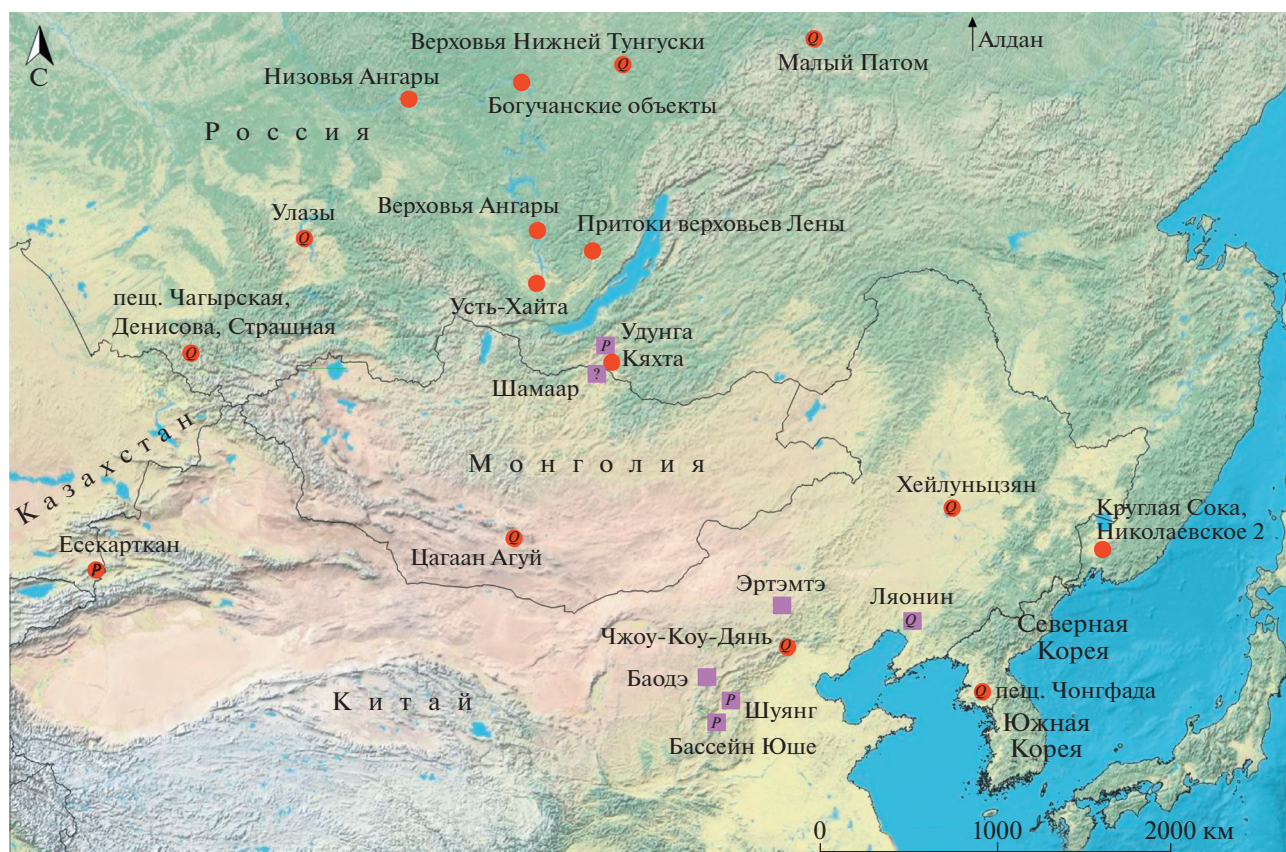
● Castor fiber (Плейстоцен (O)-голоцен) ■ Castor (Sinocaster) anderssoni (Миоцен-плиоцен (P))

также известен из плиоцена Забайкалья, в бассейне р. Селенги [9]. Указание на присутствие C. (S.) cf. zdanskyi в местонахождении Шамар [10] не подтверждено морфологическим описанием. Вероятно, эти мио-плиоценовые представители подрода Sinocaster были указаны по единичным экземплярам в Монголии: Castor sp. (без подроб-