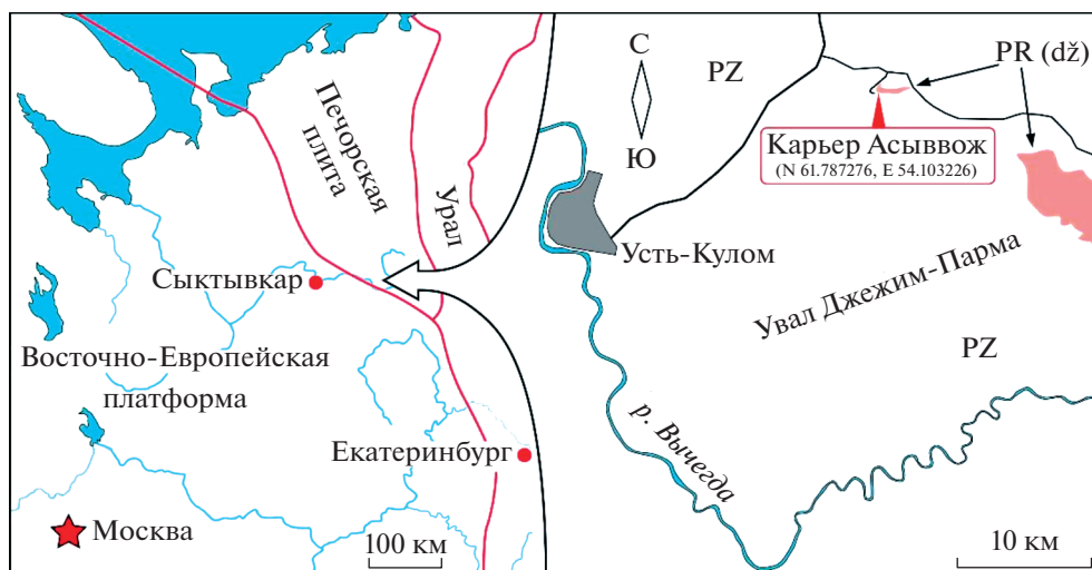
Рис. 1. Схема расположения нового местонахождения остатков организмов эдиакарского типа на северо-восточном обрамлении Восточно-Европейской платформы.

переслаивающихся алевролитов и песчаников мощностью до 50 см. Палеонтологические остатки приурочены к одному из таких пакетов на отметке 12 м от основания видимой части разреза джемимской свиты. Собранная нами коллекция состоит из 84 экземпляров представителей палеопасцихрид, органов прикрепления фрондоморфных организмов, чуариоморф, ископаемых следов жизнедеятельности и микробных колоний.