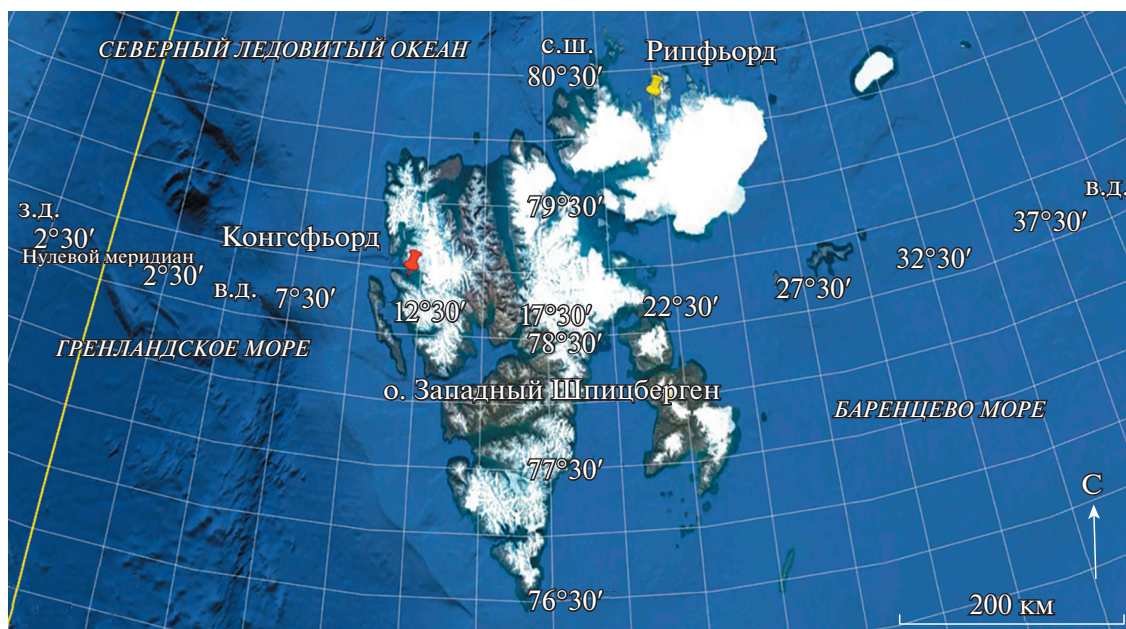
Рис. 1. Район сбора проб в акватории архипелага Шпицберген (Конгсфьорд (красная метка) и Рипфьорд (желтая метка)).

ихтиофауны лептоклина пятнистого Leptoclinus maculatus в фьордах различных доменов имеют особый интерес, так как важны для понимания адаптивных механизмов трансформации вещества и энергии (в данном случае – липидной природы) как в самом организме животного, так и в пищевых цепях арктических экосистем, незаменимым объектом которых он является.