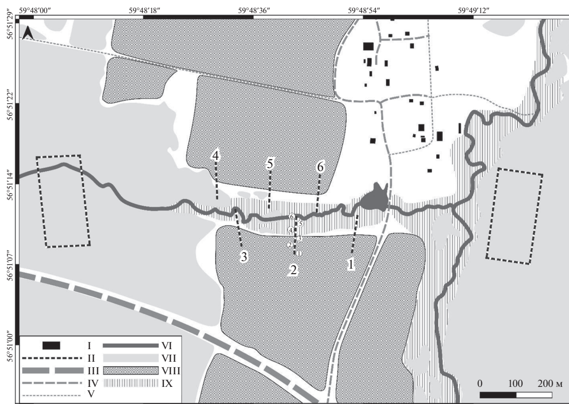
Рис. 1. Пространственный план эксперимента: I – здания; II – площадки мечения и линии заборчиков; III – асфальтированные дороги; IV – гравийные дороги; V – грунтовые дороги; VI – реки; VII – лес; VIII – обрабатываемые поля; IX – прирусловая растительность; крупные цифры – номера учетных линий, мелкие – номера цилиндров.

заборчиков не вкапывали, а фиксировали в земле с помощью гвоздей с пластиковыми шайбами. Цилиндры из пластика (по 6 на линию) диаметром 30 см и глубиной 50 см устанавливали через 15 м друг от друга. Одна половина каждой линии находилась в поле (цилиндры 1–3), а вторая – в пойме (цилиндры 4–6). Каждый цилиндр в линиях 1, 2 и 6 был дополнен четырьмя короткими (1 м) заборчиками, отходящими от оси основного заборчика на 45° [4].