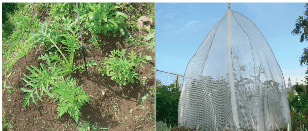
Рис. 2. Стационарный садок для Menida violacea Motsch. с растениями Ambrosia artemisiifolia, Cirsium setosum и Agrimonia striata.