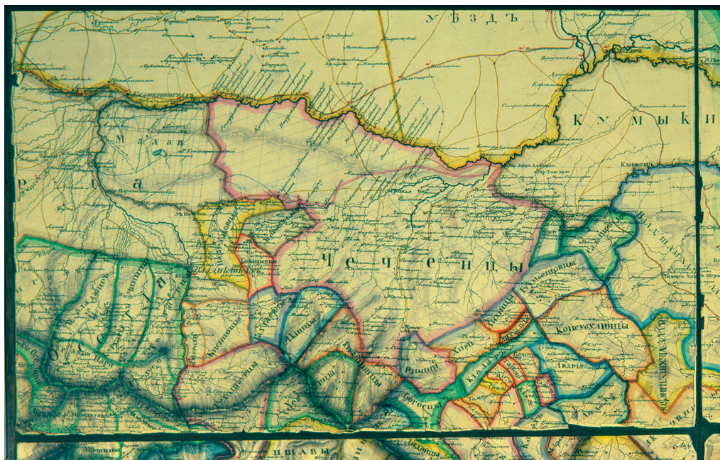
Рис. 2. Карта Кавказского края с пограничными землями Генерального Штаба Степного Кавказского корпуса, 1834 г.

Проводимые в 1835–1838 гг. военные действия России на Северо-Восточном Кавказе (АКАК 1881: Т. VIII. Л. 388) свидетельствуют, что в этот период в состав российских войск, совершавших нападения на немирных карабулаков и