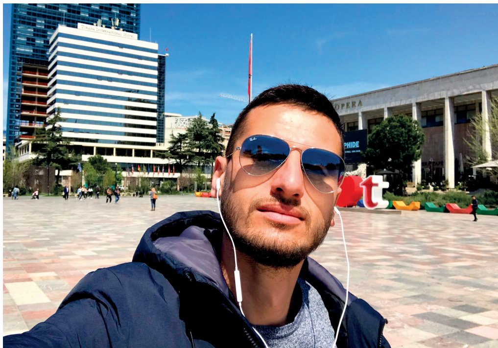
Рис. 3. На площади Скандербег с информантом экспедиции. Тирана, Албания. Май 2022 г.

ветвленной сети одного бизнеса, а об усилиях многочисленных домовладельцев, стремящихся извлечь выгоду из своей недвижимости и страстей других. Эта ситуация обусловлена тем, что албанцы чаще всего живут большими семьями в одном доме или квартире: неженатые и незамужние дети обычно остаются с родителями, здесь же проживают бабушка и/или дедушка. Даже если у взрослых детей стабильные и высокие доходы, они не стремятся обособиться, снять или купить отдельное жилье – это считается не совсем приличным. Схожая ситуация, впрочем, наблюдается и в соседних балканских странах. Так, к примеру, мой знакомый, 40-летний грек из Афин, владелец туристической фирмы, жил вместе с родителями, а для интимных встреч снимал квартиру в центре города у площади Синтагма; о тратах своего сына родители, естественно, ничего не знали (ПМА 2004).