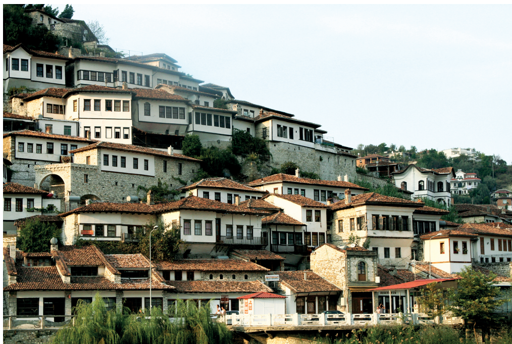
Рис. 1. Берат, Албания. Сентябрь 2010 г.

свое значение: со II в. н.э. в Эпидамне (бывшем Диррахии) подпольно функционирует христианский храм; в III в. погибает Аполлония вследствие катастрофического землетрясения; в 551 г. после нападения вестготов Бутринт с его роскошными театром и стадионом постепенно превращается в пастбище для овец и коз ( Anamali, Prifti 2002). Смена парадигмы отношения к выпячиванию либо, наоборот, сокрытию интимной стороны жизни, равно как и к собственному телу, произошла в период правления Византии – с V по XV в. В государстве, идеологически опиравшемся на христианскую доктрину, была принята аскеза: отрицание физического и физиологического начал в человеке и утверждение превалирования духовного, соответственно, осуждение греховной телесности и всего, что может вызвать “дурные” мысли и желания. Изгнание “беса греха” стало на долгий период определять внешний вид и отношение человека к окружающему миру. Любые сексуальные отношения вне брака строго порицались, а отклонение от нормы грозило казнью на костре (так в правление Юстиниана стали караться уличенные в гомосексуальных связях, что быстро редуцировало укоренившуюся, как писали современники, среди мужчин в эпоху античности однополую любовь) (Io Διεθνες 2003).