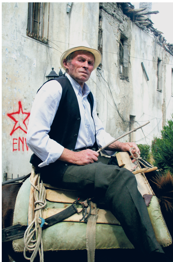
Рис. 2. Пожилой албанец на муле; патриархальные картины можно увидеть в центре города и сегодня. Гирокастра, Албания. Сентябрь 2010 г.

у албанцев разных регионов Албании. Одно оставалось долгое время неизменным для большинства жителей страны: вера в “вековые нравственные устои общества” ( Gjeçovi, Fox 1989 ), которые, казалось, не допускали никаких моральных отступлений – ни неконтролируемых взаимоотношений между полами, ни тем более такого явления как проституция.