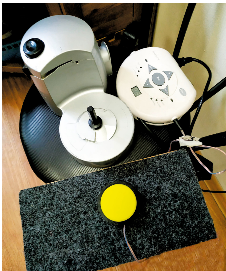
Рис. 3. Блендер, используемый на занятиях по кулинарии. Чаша снята после занятия.

Занятие начинается, когда Евгений кладет изображение кружки, и заканчивается, когда она убирается со стола Леонидом. Кружка, снятая с доски, перенесенная на кухню и положенная перед Аней, связывает активность в зале с событиями на кухне, она напоминает, что происходящее требует от нее совместных действий. Для приготовления пищи нужно переключить внимание на продукты. Но Аня не заинтересовалась этим. Евгений обращает внимание на способность