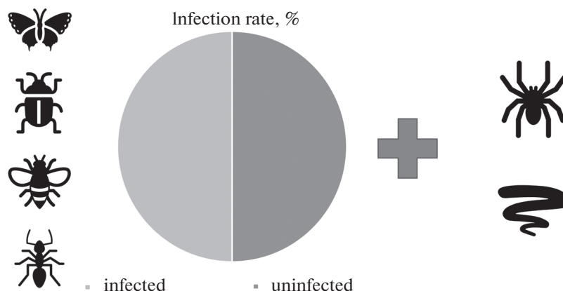
Рис. 1. Распространенность эндосимбиотической бактерии Wolbachia pipentis у насекомых, паукообразных и нематод.

тканях наблюдались более высокие титры, чем в соматических тканях [18, 19]. Кроме того, титр Wolbachia может зависеть от температуры окружающей среды. Например, Drosophila nigrosparsa , выращенные при температуре ниже 19°C, имели более высокий титр Wolbachia по сравнению с особями, выращенными при высокой температуре [20]. Также и у особей Drosophila melanogaster , развившихся при 13°C, была обнаружена более высокая плотность Wolbachia , чем у тех, которые развивались при 31°C [21]. Изменяя титр Wolbachia в яйцах, температура влияет и на выраженность андроцида у Drosophila bifasciata [22]. У D. melanogaster плотность Wolbachia варьируется в том числе и в зависимости от рациона [23]: мухи, выращенные на корме, обогащенном сахарозой, имели повышенный титр бактерии в оогенезе, а выращенные на корме, обогащенном дрожжами — наоборот, пониженный. Скорость гибели мух, индуцированной штаммом Wolbachia wMelPop , у D. melanogaster положительно коррелирует с титром бактерии [24]. Титр также может изменяться с возрастом хозяина, что наблюдается у многих членистоногих, включая Drosophila spp. [15, 25–28]. Поскольку ранее было показано, что у самок D. melanogaster с возрастом происходит снижение деления стволовых клеток зародышевой линии [29], а Wolbachia наиболее представлена в репродуктивных тканях хозяина [30–32], снижение титра Wolbachia при приближении мух к четырехнедельному возрасту можно объяснить снижением деления стволовых клеток зародышевой линии.