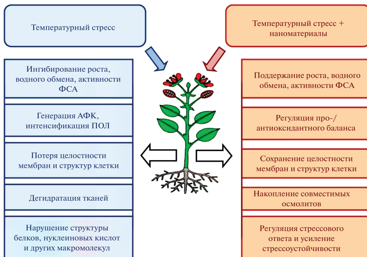
Рис. 1. Защитные эффекты наноматериалов на растения в условиях температурного стресса.

увеличиваются скорости электронного транспорта, фотофосфорилирования и выхода кислорода [60, 63].