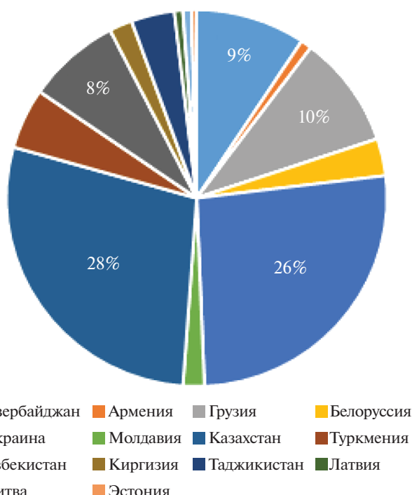
Рис. 2. Распределение мигрантов по местам рождения из республик бывшего СССР (три города вместе).

стах рождения 23881 русского жителя этих городов, мигрантами в эти города оказались 12296 чел. (51.5%).