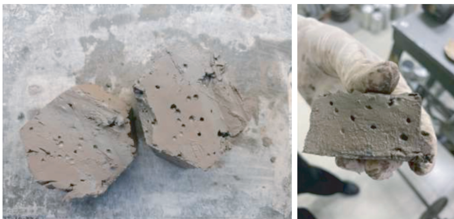
Рис. 2. Макропоры в образцах тиксотропных супесей ледникового генезиса, залегающих над микулинскими газогенерирующими отложениями.

личествах, его определение не отвечает физико-химическим условиям генерации \text{CH}_4 , \text{H}_2 , \text{N}_2 и \text{H}_2\text{S} .