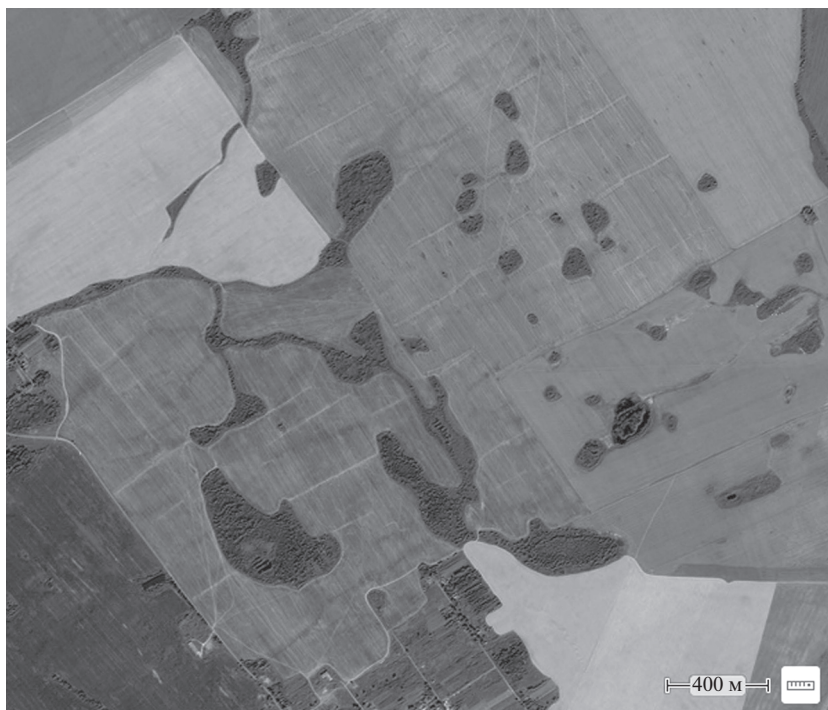
Рис. 2. Суффозионный рельеф западной части Горецкой моренной равнины с краевыми ледниковыми образованиями (Оршанский район Витебской области) [22].

устанавливаются в прямой зависимости от мощности лессовой толщи. 70% общей площади западин приходится на участки с мощностью лессовых и лессовидных грунтов более 4 м [3].