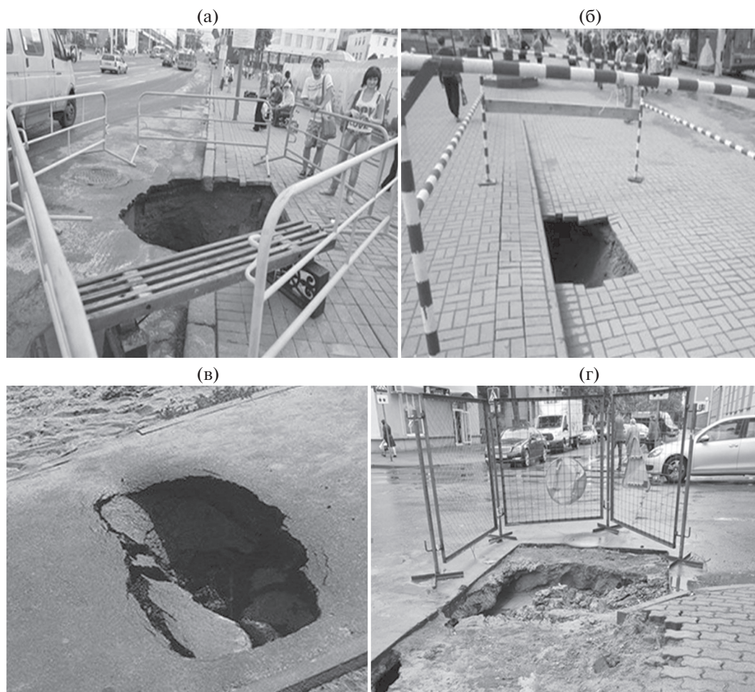
Рис. 6. Деформации тротуаров, вызванные суффозией, в: а, б – Витебске вблизи летнего Амфитеатра (2011 и 2012); в – Гомеле вблизи парка “Фестивальный” (2020); г – Бресте на перекрестке улиц Мицкевича и Куйбышева (2020) [1, 5, 17, 18].

ных каналов и т.д., но и с проведением непосредственно самих работ.