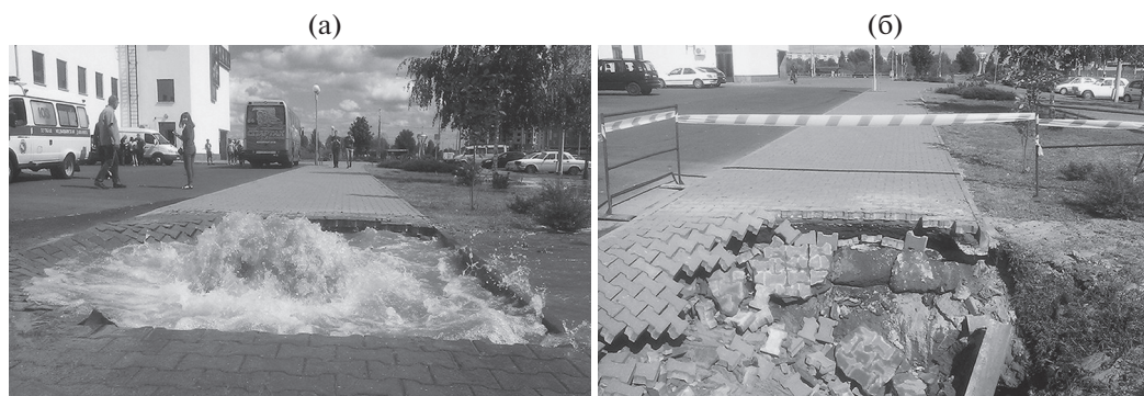
Рис. 5. Прорыв водопроводной трубы, вызвавший суффозионный размыв грунта (а), и его последствия вблизи Ледового дворца в Гомеле, 2013 г. (б) [6].

коллектора, расположенного в толще техногенных песчано-глинистых грунтов на глубине более 3 м, под асфальтовым покрытием автомобильной дороги образовалась суффозионная воронка глубиной более 2 м и площадью 16 м 2 . В результате движение транспорта было парализовано до вечера того же дня, пока коммунальные и дорожные службы не выполнили все необходимые ремонтные работы. Позднее в Минске крупные суффозионные провалы фиксировались на пересечении улиц Клары Цеткин и Мясникова (2016), на улицах Кирова (2017), Фабричной (2018) и в других местах.