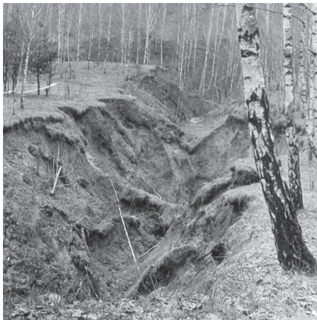
Рис. 4. Овраг на склоне балки в урочище “Булавки” Мозырского района Гомельской обл., сформировавшийся в результате провалов над суффозионными каналами (фото А.И. Павловского, 1993).

Суффозия, развивающаяся в техногенно нарушенных условиях (например, на урбанизированных территориях, участках гидротехнических сооружений, в береговой зоне водохранилищ и т.д.), заслуживает особого внимания, поскольку ее проявления по своей интенсивности и причиненному ущербу часто превосходят природную.