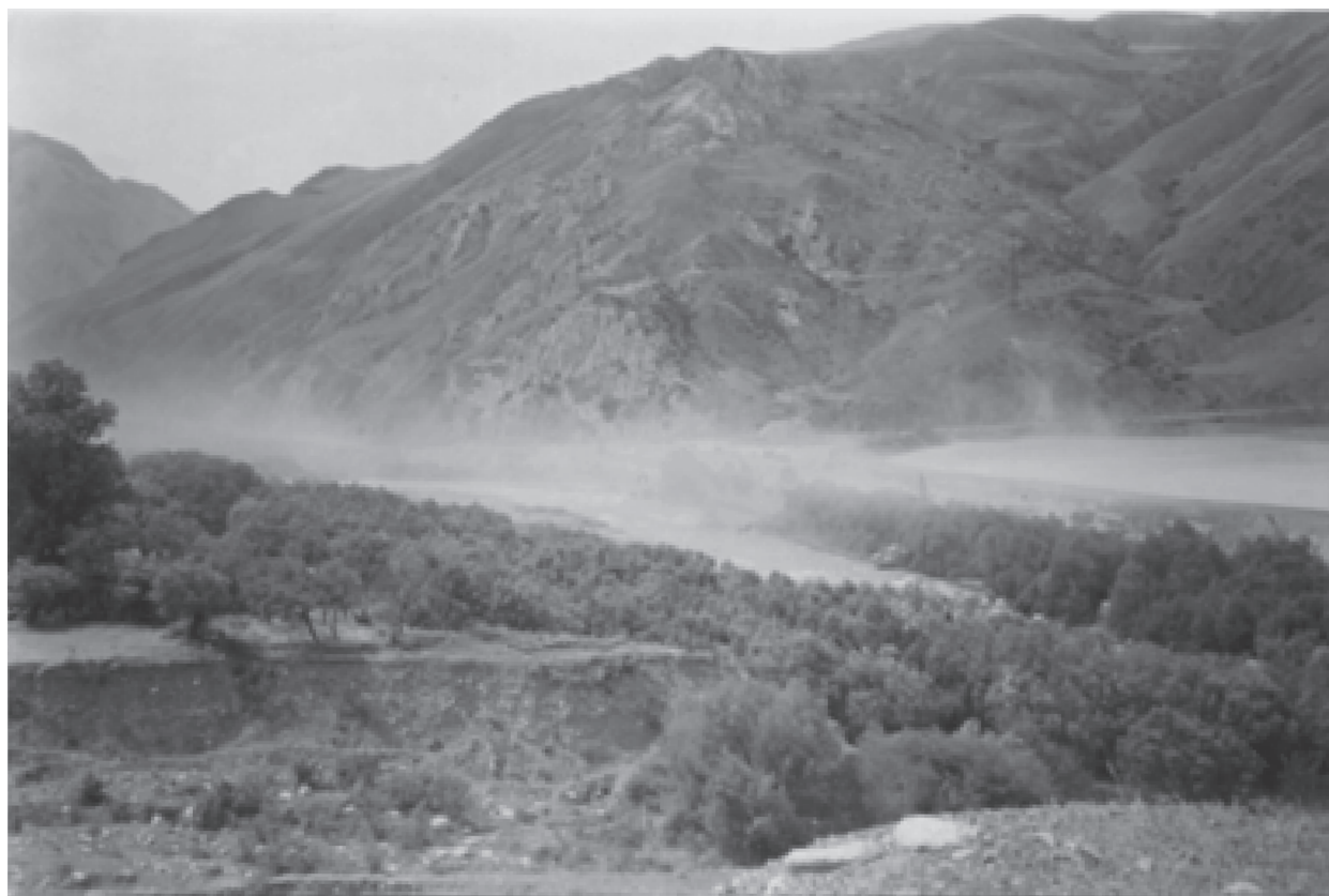
Рис. 2. Дефляция пульпы с поверхности Унальского хвостохранилища.

Максимальное значение ФА наблюдается для листьев березы в точке 3, около сливной трубы из хвостохранилища, в 50–60 м от его бетонной стены ( 0.0539 \pm 0.0214 ). При этом для листьев, отобранных с восточной части, параметр ФА достигает 0.0717 \pm 0.0412 . Подобное явление наблюдается и в точке 1 (напротив хвостохранилища), где