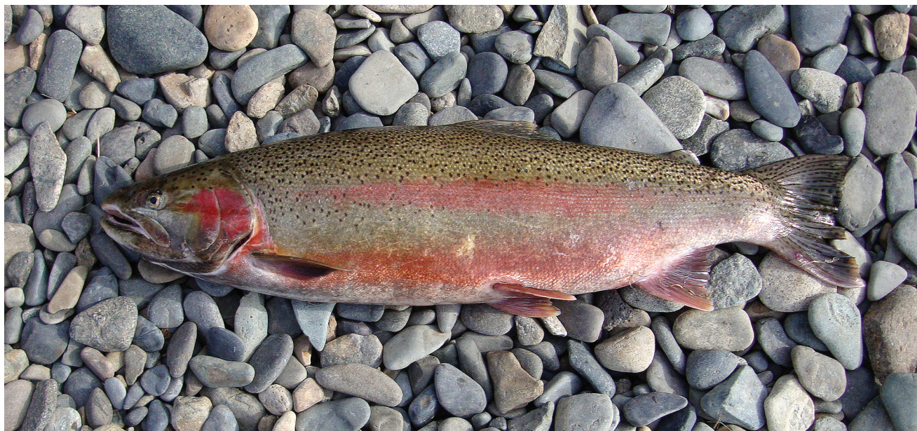
Рис. 2. Проходная микижа Parasalmo mykiss р. Ботчи (поймана 23 мая 2018 г. в устье р. Матвеевка), абсолютная длина тела 78 см, масса тела 5.5 кг, самец, половые железы V стадии зрелости.

микижи в реках Южного Приморья с активным развитием марикультуры радужной форели в Японии, Южной Корее и Китае, а начиная с 2005 г. и в России (Барабанчиков, 2014). По мнению этого автора, обнаруженные в реках Уссурийского залива особи микижи могут иметь заводское происхождение 2 . Известно, что в Китае и Южной Корее, где этот вид давно является объектом аквакультуры, он как инвазивный отмечен в реках на побережье Жёлтого моря (Lutaenko et al., 2013). Кроме того, не исключена и нелегальная интродукция искусственной радужной форели (Барабанчиков, 2014). Тем не менее исключать инвазию искусственно выращенных рыб нельзя, так как есть указание на поимку в 2018 г. микижи на северо-восточном побережье Сахалина в р. Лангери (Кириллова, Кириллов, 2019), хотя ранее её на Сахалине не обнаруживали (Dyldin, Orlov, 2016). Микижа, пойманная в р. Лангери, имела облик, характерный для резидентных особей или рыб садкового выращивания (Е.А. Кириллова, личное сообщение и фотография). В то же время особи, обнаруженные в реках материкового побережья Татарского пролива и лимана Амура, в отличие от рыб из Японского моря и рек Уссурийского залива имеют иные размеры, пропорции тела и окраску, всего вероятнее, принадлежат к проходной форме и не связаны с распространением искусственно выращенной радужной форели. В Хабаровском крае микижу несколько лет выращивают на Анюйском