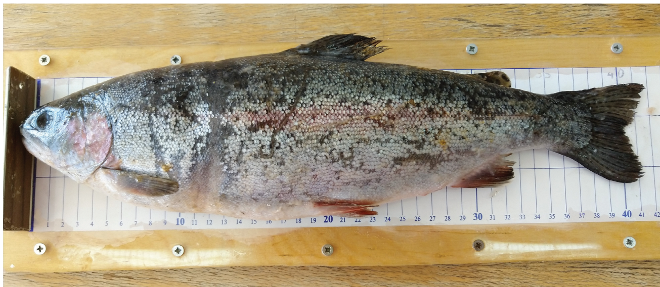
Рис. 2. Микижа Parasalmo mykiss – самка FL 40.0 см, масса 1006 г, гонады II стадии зрелости, поймана 26.02.2019 г. в оз. Валентины (о. Кунашир).