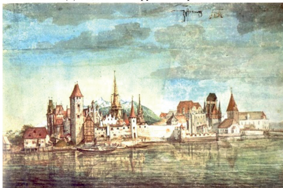
(в) Вид на Инсбрук с севера. 1496 г.