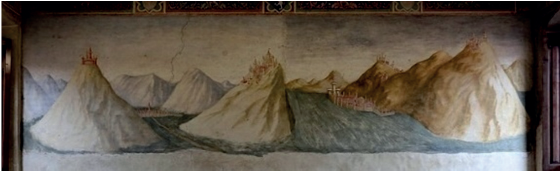
Рис. 4. Фреска Мазолино да Паникале “Горный ландшафт” во дворце кардинала Бранды Кастильоне в г. Варезе (Италия), 1435 г.

тенсифицируется. Оконные и фоновые пейзажи, пейзажи-условия и пейзажи-участники насыщаются и перенасыщаются элементами ландшафта, все большее и большее внимание уделяется изображениям метеорологических явлений, животных, растений, а также разного рода сооружений и их остатков – руин. Пейзажные детали – элементы ландшафта выписываются со все большей и большей тщательностью, вниманием и точностью. Расширяется список сюжетных линий, более частой становится мифологическая, архитектурная, хозяйственная тематика. В процесс “пейзажестворения” активнее вмешиваются оконные ландшафты (особенно в сюжетной линии “Мадонна с Младенцем”). Постепенно расширяясь и расширяясь, к концу XV в. они начинают вытеснять не-пейзажные сюжеты на “композиционную периферию” или, как минимум, композиционно уравниваться с ними на изображении.