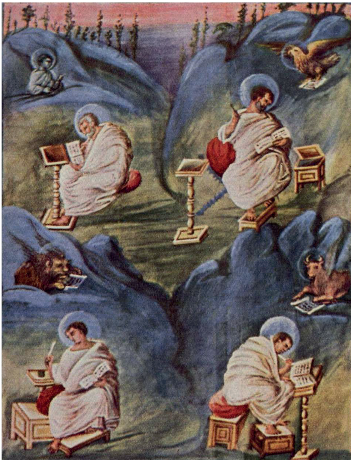
Рис. 2. Иллюстрация “Четыре Евангелиста” из Евангелия Годескалька, 780-е годы.