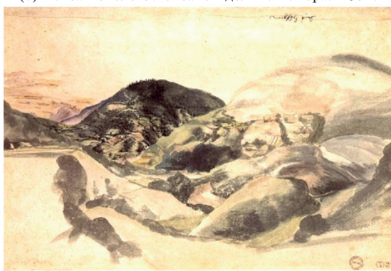
(г) Ивовая мельница. 1496–1498 гг.