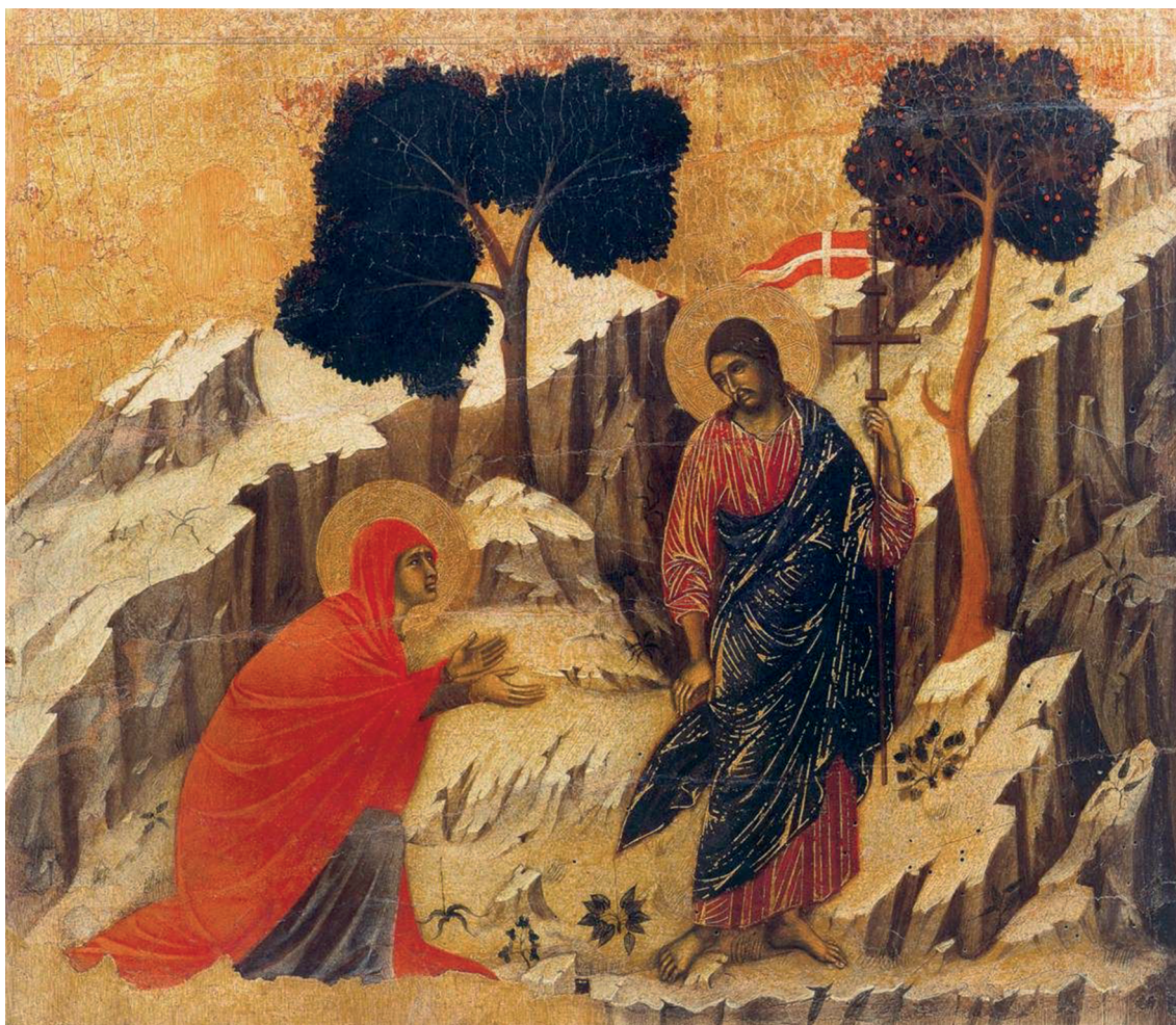
Рис. 3. Сцена жизни Иисуса (“Не касайся меня”) на иконостасе “Маэста” Дуччо ди Буонинсеня, 1308–1311 гг.

географическую — “идеологию” живописного искусства: изображение ландшафта как такового. По нашему мнению, в росписях “Циклы месяцев” такой шаг уже сделан. Но это еще можно оспорить. Бесспорные же пейзажи-как-таковые — достояние уже следующего столетия, кватроченто (1401–1500 гг.).