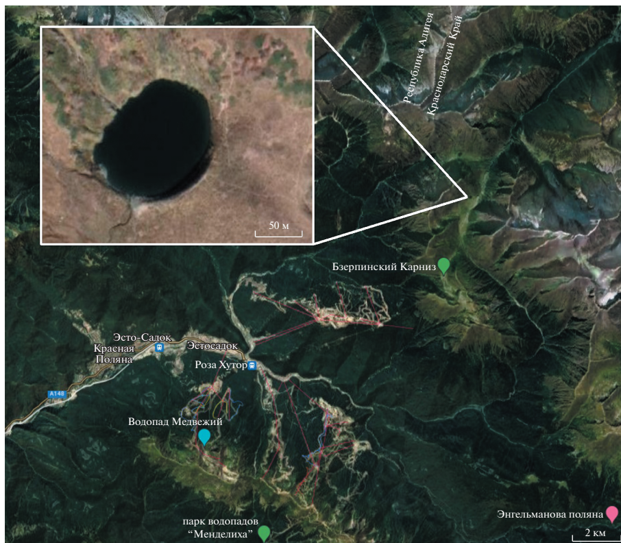
Рис. 1. Географическое расположение оз. Большое Дзитаку.