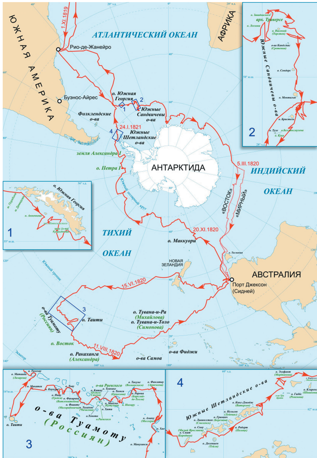
Рис. 2. Схема маршрута Русской Антарктической экспедиции в 1819–1821 гг.

Красные линии со стрелками и цифрами – отрезки и направления плавания с их датами; синие цифры – номера увеличенных участков плавания в зоне островов; зелёным цветом обозначены названия островов, которые были даны во время экспедиции [13]