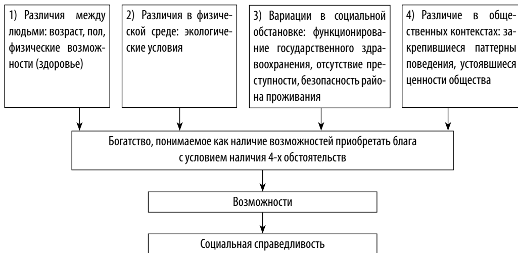
Рисунок 1. Схема подхода возможностей по А. Сену

Подытожим идеи А. Сена. Очевидно, что сам по себе высокий доход и другие блага не говорят о наличии у человека возможностей. Они лишь средства для достижения цели, сама же цель – обрести возможности, наличие которых, возможно, приведет к тому, что общество будут оценивать как справедливое. Тем не менее, сами по себе возможности нельзя операционализировать, так как многие из них не поддаются измерению – например, возможность прожить жизнь до старости и др. Поэтому автор воспользовался положением Сена, согласно которому возможности следует оценивать через средства, такие как богатство, однако оно определяется не только данными о доходе и возможностью приобретать блага, а в совокупности с наличием других средств для достижения возможностей: пол, физические возможности, экологические условия, функционирование государственного здравоохранения, отсутствие преступности, безопасность района, устоявшиеся ценности общества (рис. 1). Таким образом, гипотеза исследования заключается в том, что наличие средств достижения возможностей будет способствовать восприятию общества молодыми людьми как справедливого.