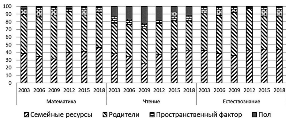
Рисунок 4. Вклад отдельных групп факторов-обстоятельств в неравенство возможностей в Чехии Figure 4. The contribution of certain groups of factors-circumstances to the inequality of opportunities in the Czech Republic