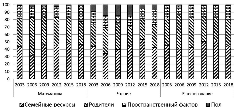
Рисунок 5. Вклад отдельных групп факторов-обстоятельств в неравенство возможностей в Венгрии