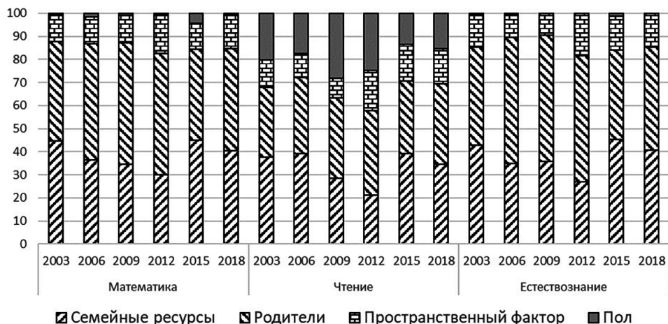
Рисунок 6. Вклад отдельных групп факторов-обстоятельств в неравенство возможностей в Польше