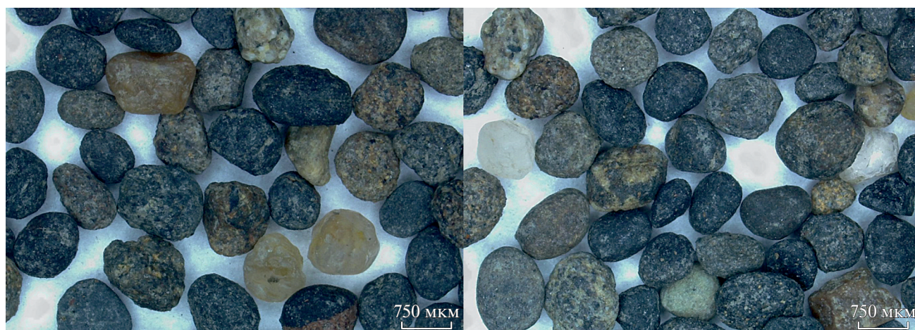
Рис. 4. Микрофотография песка, отобранного с ледовой поверхности близ полуострова Быковский. Снимок получен с помощью стереомикроскопа Leica DVM6.

ческого вещества. В исследованном районе губы Буор-Хая на заснеженной ледовой поверхности в период экспедиций были обнаружены наносы мелких древесных и травянистых остатков, также формирующих локальные скопления. Следует учитывать, что обогащение отложений ледового комплекса органическим веществом, принесенным с суши, в периоды оледенений происходило именно по такому механизму. В пользу этого говорит преимущественно терригенное органическое вещество в криогенных отложениях прибрежной зоны Восточно-Арктического шельфа [15, 17, 22–24, 40, 53, 56, 57].