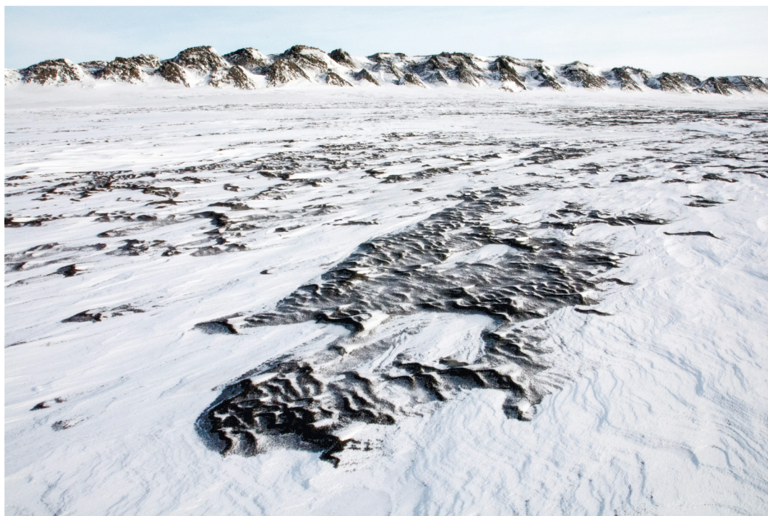
Рис. 3. Песчаные наносы на заснеженной ледовой поверхности губы Буор-Хая. На заднем плане виден характерный термоабразионный байджераховый рельеф полуострова Быковский.