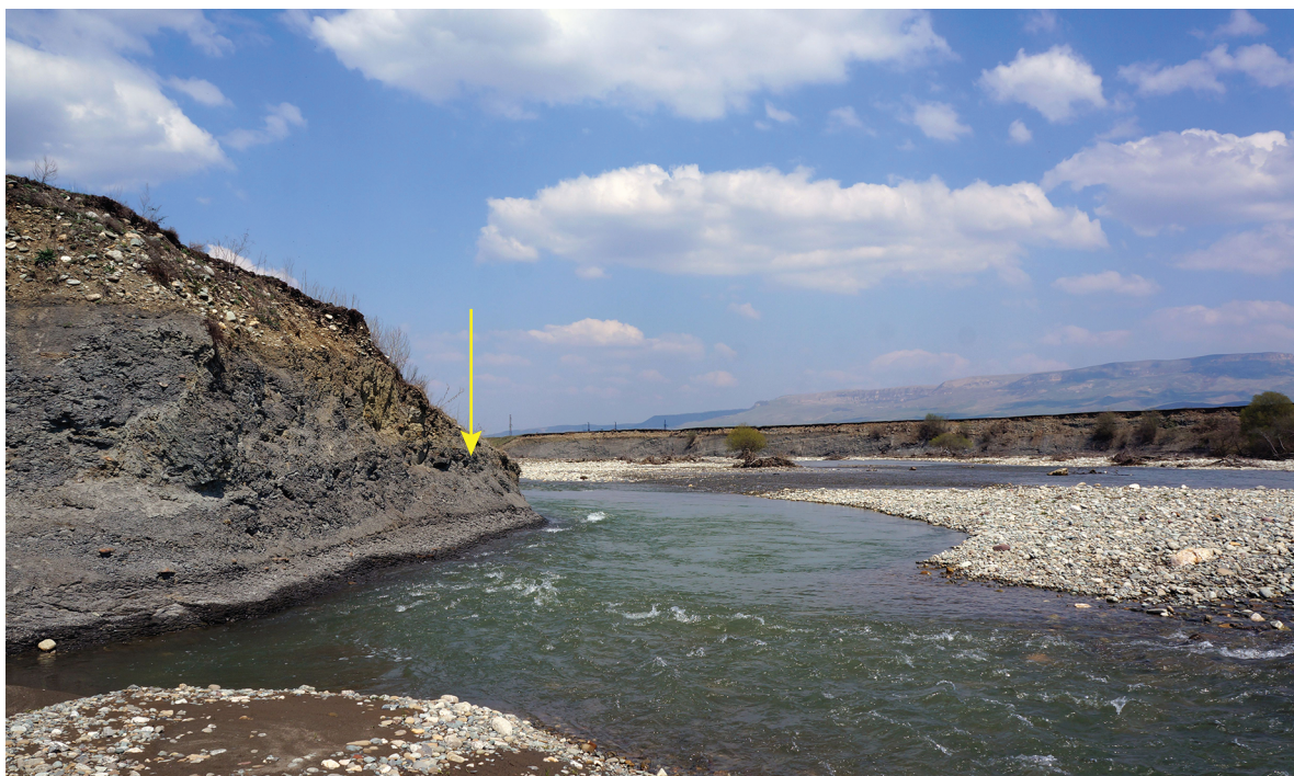
Рис. 1. Часть местонахождения № 30 на левом берегу р. Кяфар ниже ст. Сторожевая, стрелкой показан уровень находки крупного анаптиха; на заднем плане обнажение № 17 по правому берегу р. Кяфар; нижняя часть верхней подсвиты джангурской свиты; подзона Garantiana baculata зоны Strepoceras niortense верхнего байоса.

не анаптиха — в задней части под прямым, а по бокам под острым углом, так что полоса шириной 8–10 мм по периферии челюсти при виде сверху (рис. 2, в) находится вне зоны видимости. Как краевые перегибы, так и складки поверхности правого крыла частично растрескавшиеся, но чаще не несут следов разрывных нарушений.