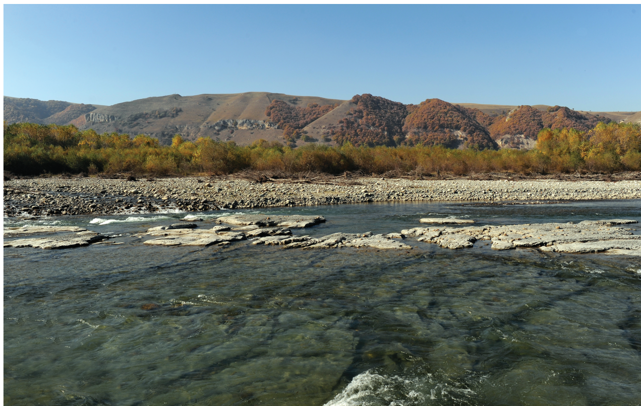
Рис. 2. Река Бол. Зеленчук ниже местонахождения 8, при низкой воде; на отмели обнажаются породы нижнего бата (зона Zigzag, слои с Organiceras scythicum ).

гестане. Позднее, в результате изучения собранных коллекций, К. Папп (Papp, 1907) описал и изобразил среди прочих ископаемых новые виды Perisphinctes Lóczyi и P. daghestanicus 1 из верхнего байоса окрестностей с. Гуниб.