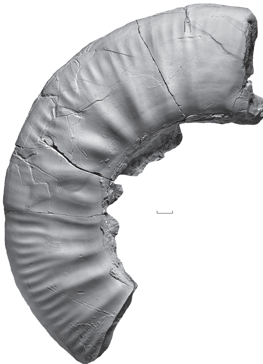
Рис. 4. Lobosphinctes dzhissaensis Mittermeier, sp. nov. [M], экз. ПИН, № 5546/362, неполная жилая камера с залеченным прижизненным повреждением, сбоку; Карачаево-Черкесия, Зеленчукский р-н, правый берег р. Бол. Зеленчук выше ст. Исправная, ниже местонахождения 8; верхняя подсвита джангурской свиты; нижний бат, сложу с Oraniceras scythicum (не in situ); сборы М.П. Шерстюкова. Длина масштабной линейки 10 мм.

ной стороной. С возрастом раковина постепенно становится уплощенной, и при D более 200 мм сечение высокоовальное. Пупок широкий; пупковая стенка крутая, перегиб закругленный. На ядрах молодых экземпляров хорошо выражены пережимы — до трех на оборот; с возрастом они становятся менее заметными.