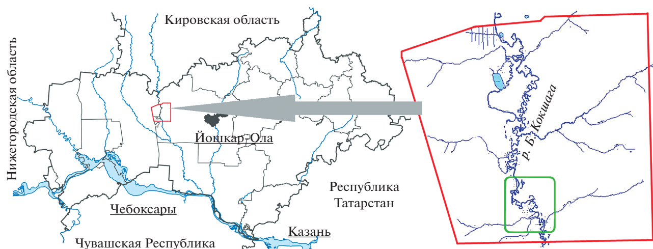
Рис. 1. Расположение заповедника “Большая Кокшага” на территории Республики Марий Эл (слева) с указанием мест отбора проб почвы (справа), выделенных квадратом.

Это сходство обусловлено, по нашему мнению, однотипным генезисом луговых и перегнойно-глеевых почв, которые формировались из сходного по валовому и гранулометрическому составу аллювия с той лишь разницей, что последние в настоящее время заболочены. Иловато-торфяные почвы достоверно не отличаются от перегнойно-глеевых по концентрации в них P, Zn, Ni, Cu и Rb.