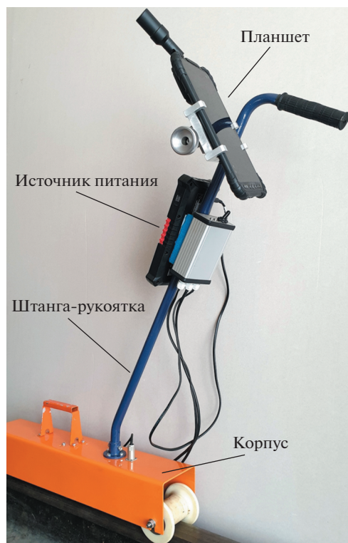
Рис. 1. Внешний вид опытного образца акустического тензометра.

измерений времени распространения головной волны с одним излучателем и двумя приемниками. Такая схема измерений позволяет компенсировать влияние теплового расширения призм из полиметилметакрилата и значительно уменьшить влияние слоя контактной жидкости и линий задержки [1, 2]. Фактически, измеряемое время соответствует времени распространения головной волны на расстояние, равное расстоянию между двумя приемниками, которое составляет около 240 мм. В результате проведенных лабораторных испытаний установлено, что опытный образец ультразвукового тензометра позволяет устойчиво