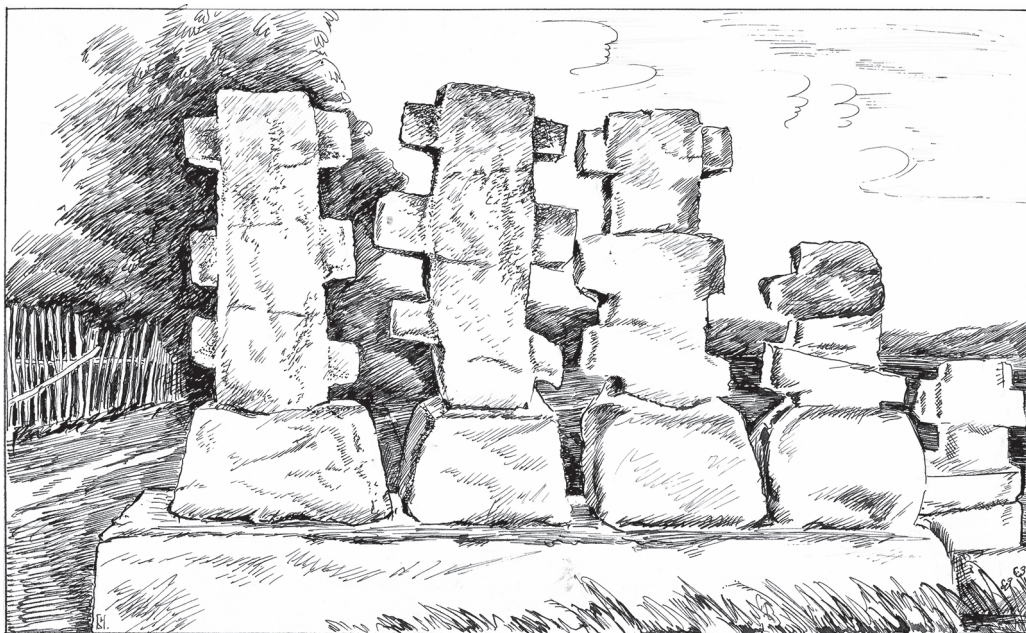
Рис. 6. Рисунок памятника “Пять Крестов”. Худ. Н.И. Башмаков, 1972 г. (по фото 1928 г.).