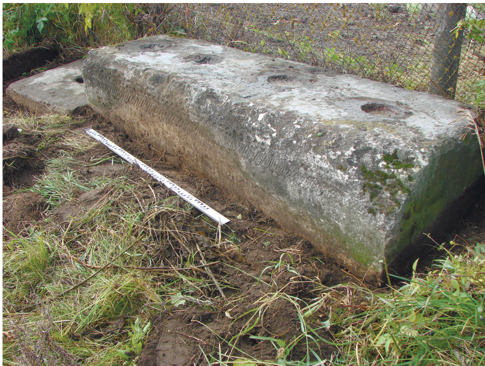
Рис. 3. Две плиты (основная и приставная малая) основания монумента. Fig. 3. Two slabs (the main and attached small ones) of the monument base.