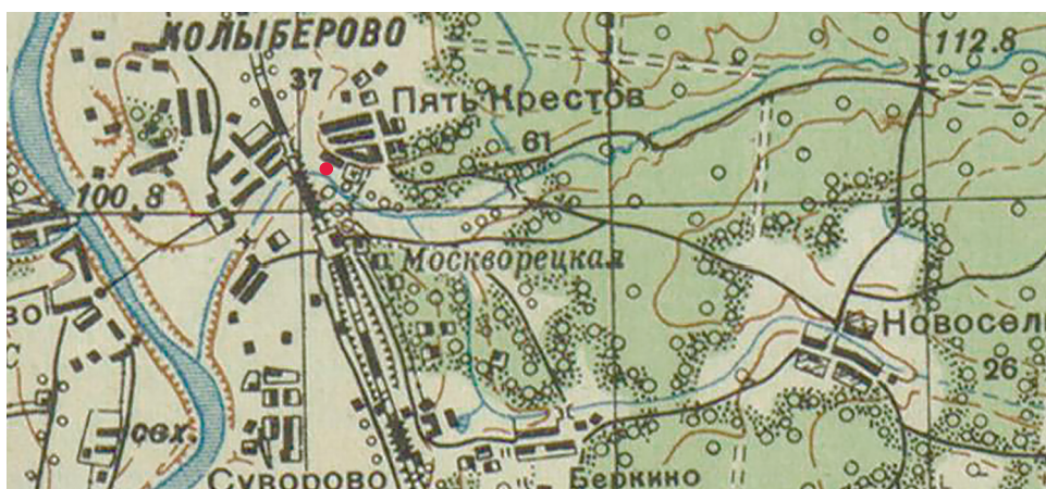
Рис. 1. Расположение памятника “Пять Крестов” (обозначено красной точкой). Карта 1941 г. Ныне местность г. Воскресенск значительно изменилась.