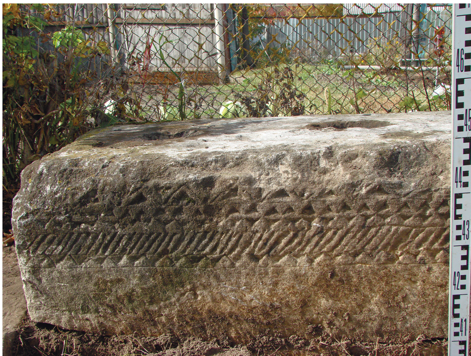
Рис. 4. Орнамент на боковых гранях основной плиты памятника. Fig. 4. Ornament on the lateral faces of the main slab of the monument.