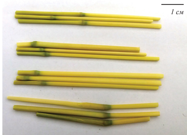
Рис. 1. Первое междоузлие соломины риса Oryza sativa L. линий удвоенных гаплоидов 209, 169, 46 и сорта Приморский 29 (сверху вниз) в фазе восковой спелости, выращенных на вегетационной площадке.

густоте стояния происходит затенение нижнего яруса и значительное полегание растений риса сорта Приморский 29 и некоторых других сортов (Дальневосточный, Приозерный 61, Дарий 23, Ханкайский 52). Линии удвоенных гаплоидов сохраняли прочность соломины и в условиях культуральной комнаты, и на вегетационной площадке (см. табл. 1, 2). Механическая прочность соломины во многом зависит от содержания калия, кремния и целлюлозы в период созревания зерна [13]. Вероятно, накопление этих элементов в растениях линий удвоенных гаплоидов не зависит от условий выращивания, что можно наблюдать визуально (см. рис. 1) и в виде более высоких значений I_c (см. табл. 1, 2).