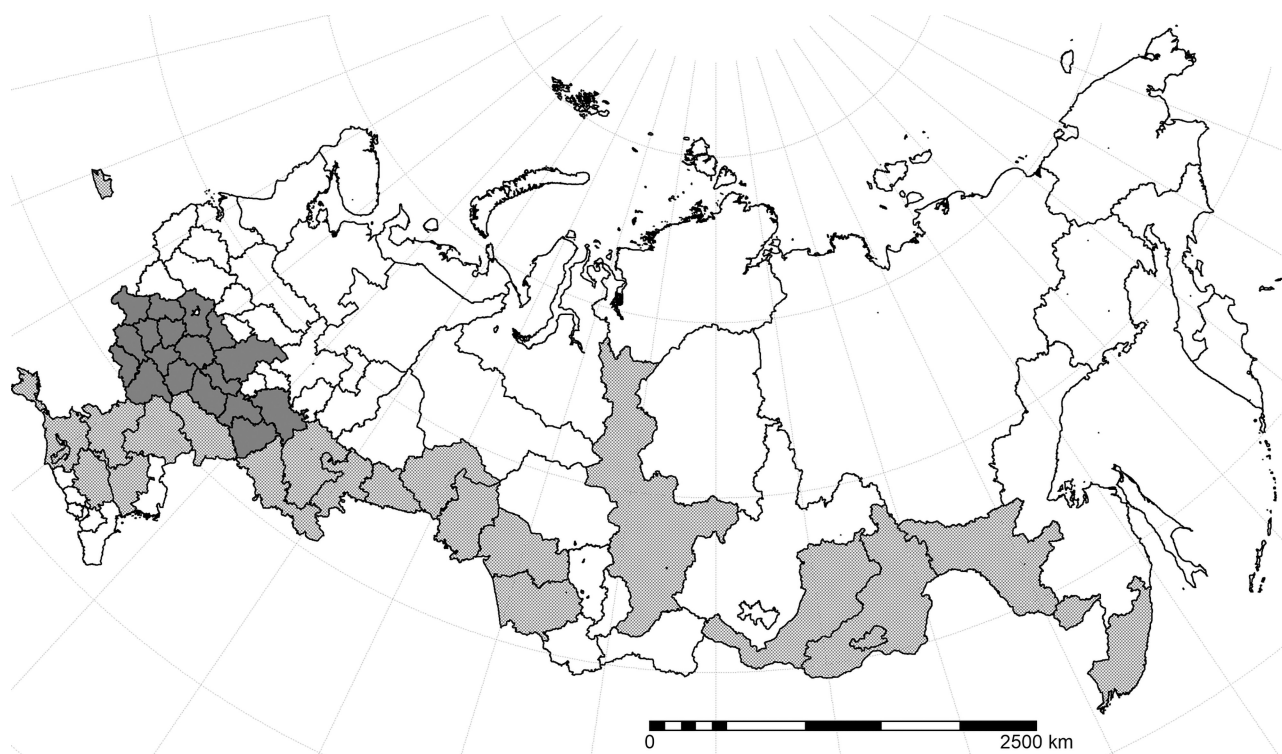
Рис. 2. Сравнение многолетнего тренда результатов моделирования потенциальной урожайности и статистических данных в разрезе регионов России: серый цвет – тренды разнонаправленные, штриховка – тренды одинаправленные, белый цвет – моделирование не проводили.

Согласно результатам моделирования в Центральном и Центрально-Черноземном округах, Верхнем Поволжье, а также на юге Средней Сибири в последние годы отмечено падение потенциальной урожайности (рис. 1). То есть, метеорологические условия в этих регионах в целом становятся менее благоприятными для зерновых. Одновременно, рост потенциальной урожайности в последние годы отмечен на Северном Кавказе, в Нижнем Поволжье, Западной Сибири и на Дальнем Востоке, что