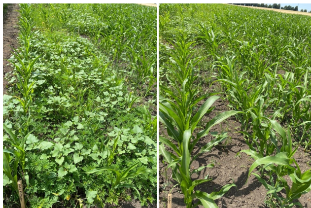
Рис. 2. Эффективность гербицида Аризон, МД 30 день после обработки: а – контроль (без гербицидов); б – Аризон, МД (2,0 л/га).

Визуальные наблюдения показали, что воздействие гербицида Аризон, МД на сорняки проявлялось спустя 3...4 дня после его применения и выражалось в задержке роста и развития, осветлении точки роста и, в дальнейшем, всего растения с последующим отмиранием, которое отмечали на протяжении 2...3 недель после использования препарата в зависимости от развития сорняков и сложившихся метеорологических условий. Признаков фитотоксического действия гербицида на растениях кукурузы не наблюдали.