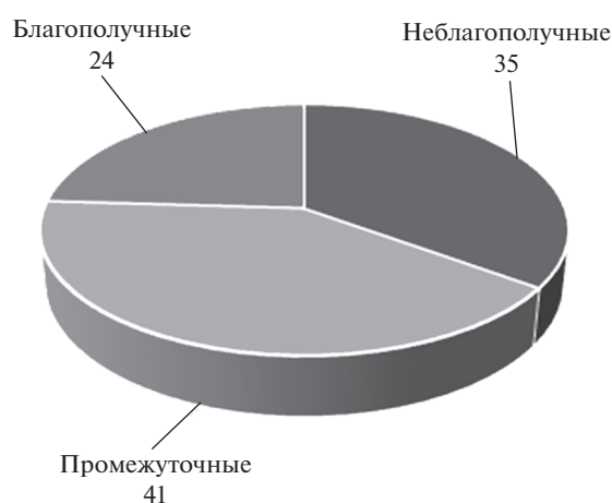
Рис. 2. Доля субъективно благополучных и неблагополучных россиян, октябрь 2018 г., %

В целях выделения групп субъективно благополучных и неблагополучных россиян учёные ФНИСЦ РАН используют кластерный анализ, учитывающий 19 показателей, связанных с удовлетворённостью либо неудовлетворённостью различными аспектами жизни. Первый кластер можно назвать субъективно благополучным: половине из всех аспектов жизни, подлежащих социологическому измерению, входящие в него респонденты ставят оценку “хорошо”. Из рисунка 2 следует, что он объединяет почти четверть наших сограждан. Второй кластер — субъективно неблагополучных россиян — отличается наиболее низким уровнем положительных и высокой долей негативных оценок, но с доминированием оценок удовлетворительных. Данный кластер охватывает 35% населения. Наконец, третий кластер можно назвать промежуточным: он характеризуется преобладанием положительных оценок, но главным образом по базовым аспектам повседневной жизни, и объединяет 41% наших сограждан. Исходя из полученных данных, можно констатировать: субъективное благополучие россиян выражается в высоких оценках их удовлетворённости практически всеми основными аспектами собственной жизни, а субъективное неблагополучие — в ярко выраженной неудовлетворённости своим материальным положением, доступностью