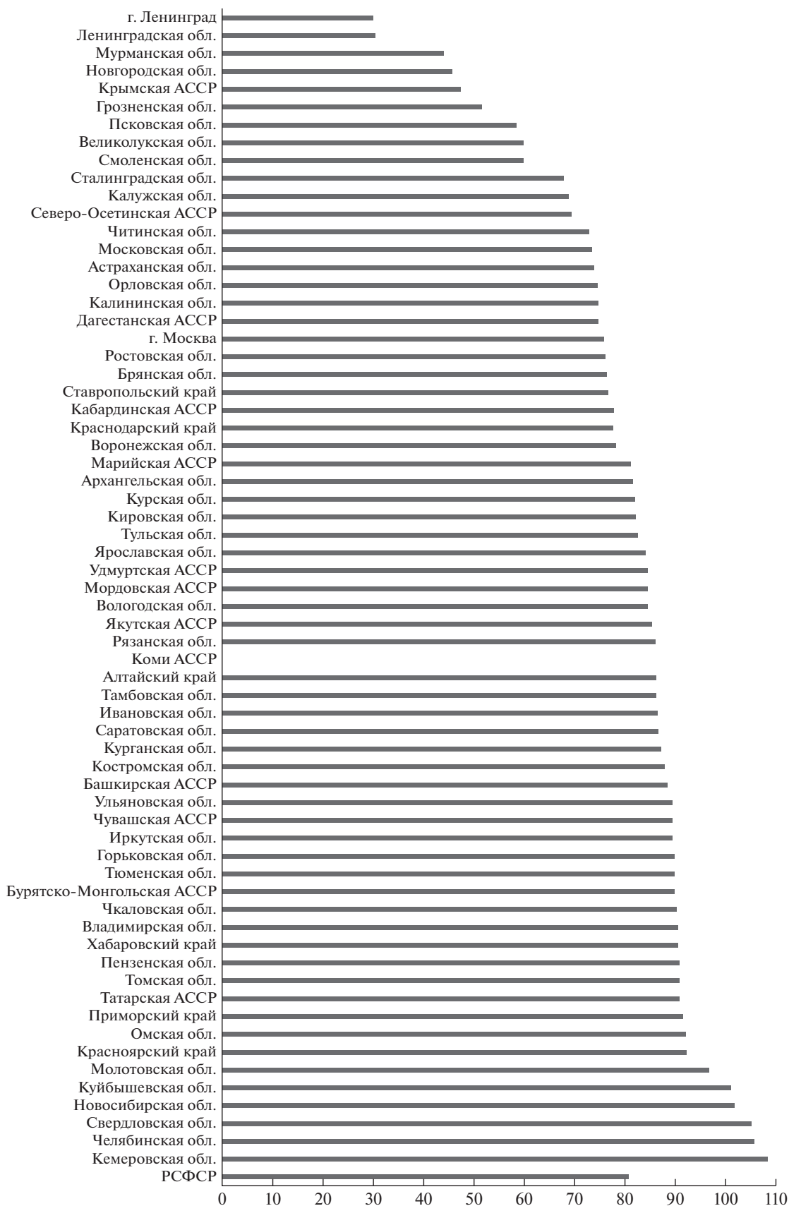
Рис. 1. Всё население РСФСР в 1945/1941 гг., %