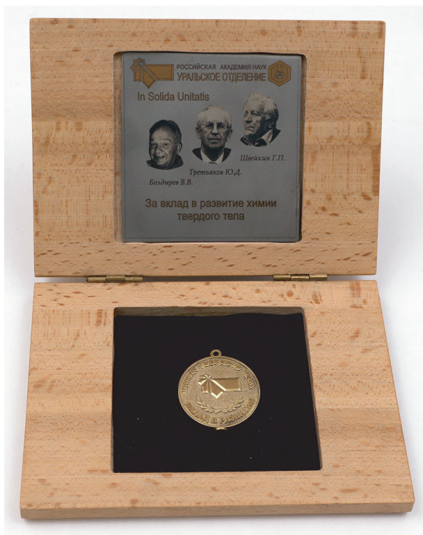
Проект наградного знака “За вклад в развитие химии твёрдого тела”, которым предлагается отмечать лучшую отечественную работу года

нической и физической химии, развить новые методы тонкого неорганического синтеза, физики твёрдого тела, включая компьютерные вычислительные методы квантовой химии и молекулярной динамики. Перечисленные составляющие обеспечили теоретическую основу появления перспективных материаловедческих направлений – синтеза ультрадисперсных порошковых материалов, получения новых высокотемпературных сверхпроводников и магнитных полупроводников, материалов для нужд фотоники, металлокерамики. Эти работы активно развиваются и в настоящее время, и неслучайно в 2020 г. сотрудники ИХТТ УрО РАН выступили с инициативой учреждения почётного знака “За вклад в развитие химии твёрдого тела”, призванного отмечать наиболее интересные отечественные фундаментальные исследования и технологические разработки в области ХТТ по результатам года. Инициатива была поддержана научной общественностью Новосибирска, Москвы и Санкт-Петербурга.