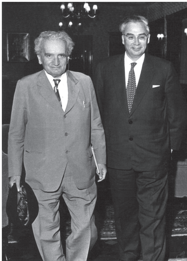
Т. фон Карман и Л.И. Седов (справа)

природные явления, высказывал критические замечания и давал оценки научным результатам других учёных. Карман оставил свой след почти во всех областях механики жидкости и газа: в теории дозвуковых, околосзвуковых, сверхзвуковых и гиперзвуковых течений, ламинарных, турбулентных и вихревых потоков и др. Многие термины носят его имя: вихревые дорожки Кармана, линия Кармана (условная верхняя граница атмосферы Земли), профили Кармана–Трефтца, оживало Кармана, тело Кармана–Мура, уравнения Фёппля – фон Кармана, формула Кармана–Тзяна, параметр околосзвукового подобия Кармана–Тзяна, параметр гиперзвукового подобия Тзяна–Кармана, уравнение Кармана–Хоурта, постоянная Кармана. В научно-организационном плане Т. фон Карман внёс существенный вклад в становление таких крупных международных научных институтов, как Международный союз по теоретической и прикладной механике, Международная академия аэронавтики, Международный совет по аэронавтике, Институт гидродинамики в Синт-Генезиус-Роде в Бельгии (ныне – его имени).