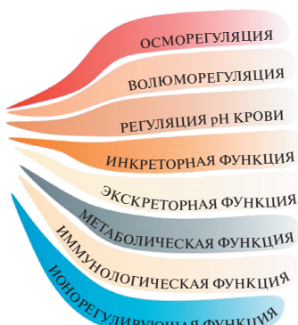
Физиологические функции лёгких и почек. Рисунок Ю.В. Наточина и Е.В. Балботкиной