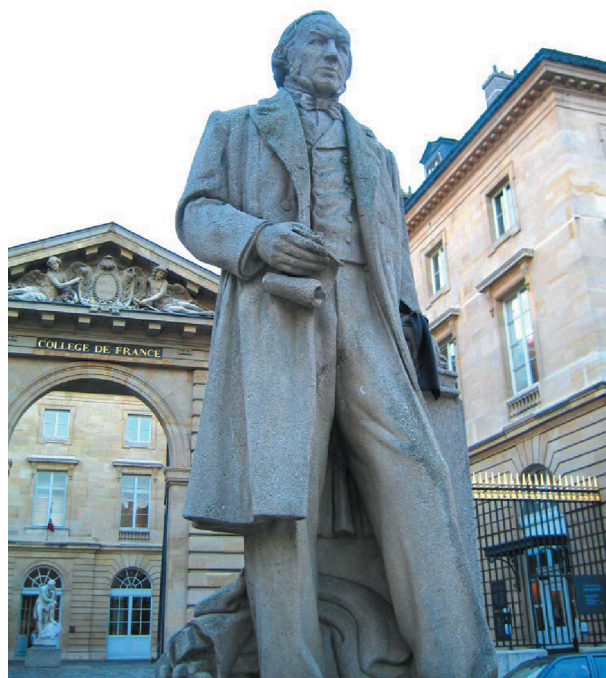
Памятник иностранному члену Императорской Санкт-Петербургской академии наук Клоду Бернару в Париже.