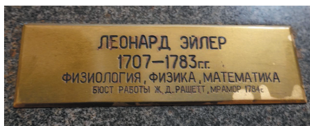
Подпись на медной основе под бюстом Л. Эйлера.

Необходимо было создать предпосылки для развития науки и системы образования, подготовки кадров для самой академии. Итогом размышлений Петра I и его советников стала оказавшаяся продуктивной государственная система науки и образования со стабильным обеспечением из казны, как и продуманная структура Академии наук, встроенной в систему государственных учреждений империи. Три века спустя можно с уверенностью говорить о выдающейся роли в решении этих проблем не только императора, но и