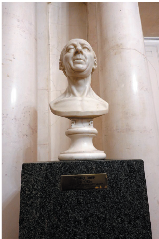
Академик Петербургской Академии наук Л. Эйлер. Бюст (мрамор) установлен в холле Президиума РАН в Москве (Ленинский пр., 14). Скульптор Ж.Д. Рашетт. 1788 г.

жеств, Академии наук СССР, Российской Академии наук [1]. Как известно, указ о создании Академии наук был подписан Петром Великим в 1724 г. В России в ту пору было всего несколько человек, получивших образование в странах Европы и защитивших диссертации. Поэтому лейб-медик императора Л.Л. Блюментрост (1692–1755), ставший первым президентом академии, и группа его единомышленников занимались поиском и приглашением в страну иностранных учёных — представителей разных областей знания.