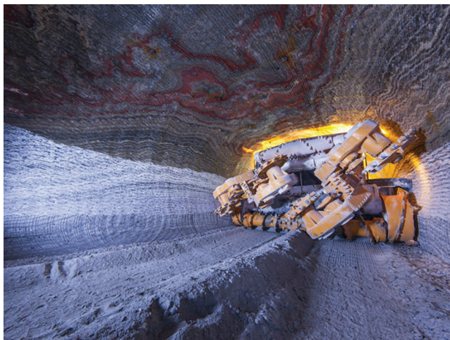
Рис. 2. Добычный комбайн с автономной системой навигации на калийном руднике

зеров, временной калибровки детекторов импульсного излучения без применения вакуума.