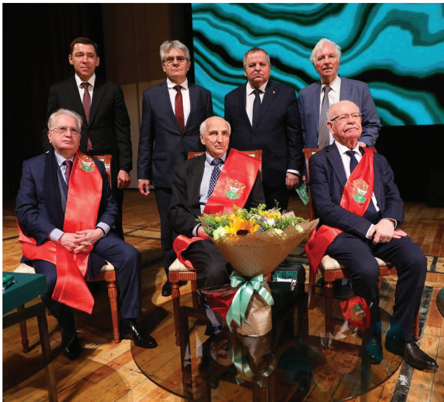
Рис. 1. Церемония вручения Демидовских премий 2021 года. Москва, Большой зал РАН, 3 июня 2022 г.

в состав Свердловского научно-промышленного кластера двойного назначения металлургии и металлообработки. Участвуя в этих двух кластерах, мы тесно взаимодействуем с подобными объединениями в других регионах России. Так, в декабре 2022 г. в УрО РАН было проведено коллегиальное совещание участников кластеров двойного назначения Свердловской и Томской областей по проблемам научно-промышленной кооперации в Урало-Сибирском регионе, на нём присутствовали представители органов государственной власти, учёные, эксперты оборонно-промышленного комплекса.