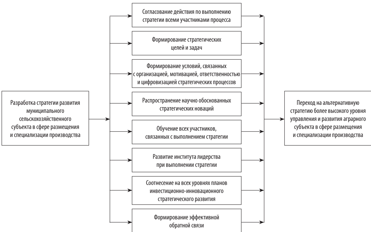
Рис. 1. Схема трансформации элементов стратегии муниципального управления хозяйствующими сельскохозяйственными субъектами в сфере размещения и специализации аграрного производства (разработана автором).

– основа – совокупность законов, закономерностей, методов и принципов с определением причинно-