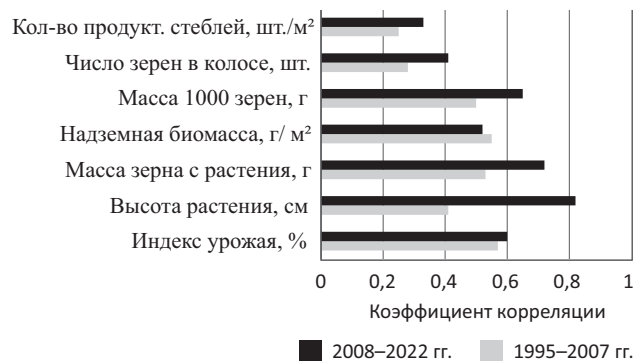
Рис. 2. Взаимосвязь урожайности с элементами ее структуры при ретроспективном анализе, 1995–2007, 2008–2022 годы.

Параметры модели сорта были подтверждены исследованиями в 2016 году (ГТК = 0,62, засуха умеренная). На высоком агрофоне урожайность по сортам в конкурсном испытании варьировала в пределах 8,63...10,1 т/га (НСР 0,5 = 0,56 т/га), на среднем агрофоне – 7,7...8,38 т/га соответственно (НСР 0,5 = 0,42 т/га).