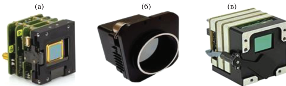
Рис. 4. Внешний вид тепловизионных модулей: а – XTM 640 PAL, б – mIR-1024M14TS, в – Eye R Core XGA.

ухудшать качество изображения, вплоть до полного ослепления камеры.