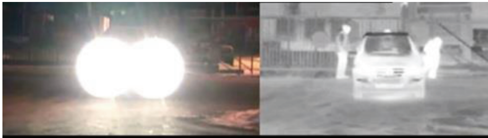
Рис. 3. Сравнение влияния засветки фарами автомобиля на обычную и тепловизионную камеры.